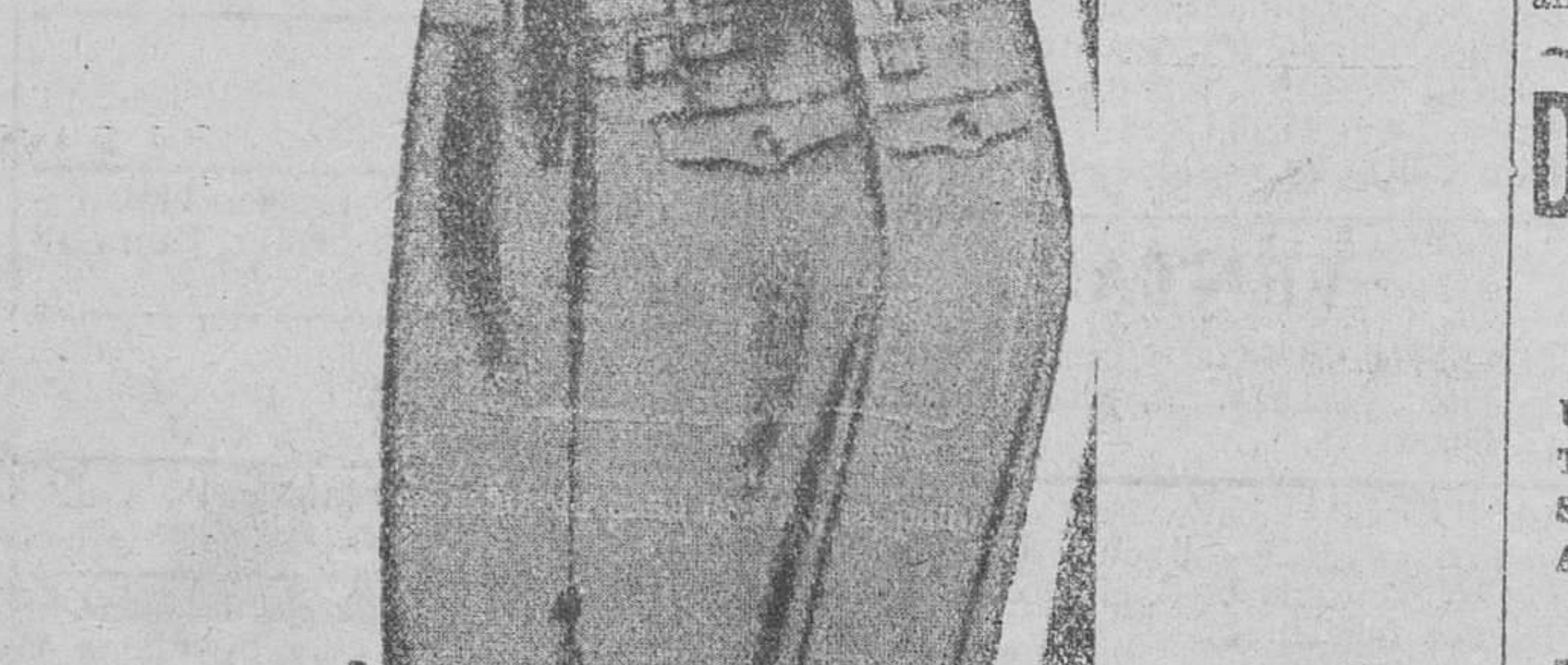
Pantalones pescador, para niño, en pana lisa negra, paño y patén, a 3, 4, 5, 6 y 8 pesetas

y otros significados jefes de derechos. El terror aumentó a raíz del afortunado bombardeo de las Rosas, realizado por nuestra escuadra sobre objetivos puramente militares y que dió por resultado el hundimiento de un barco de guerra rojo.