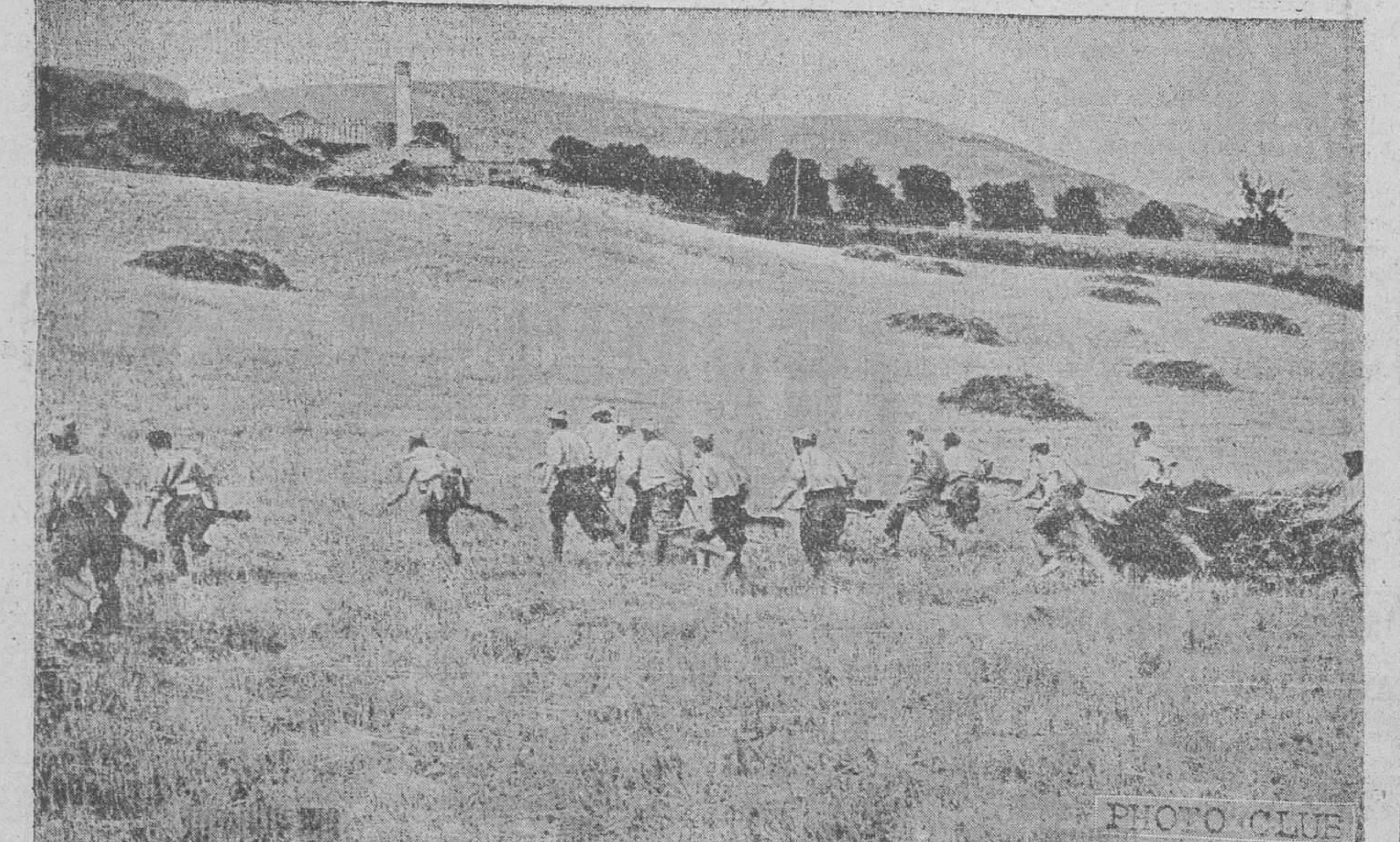
Ataque a un pueblo ocupado por el enemigo