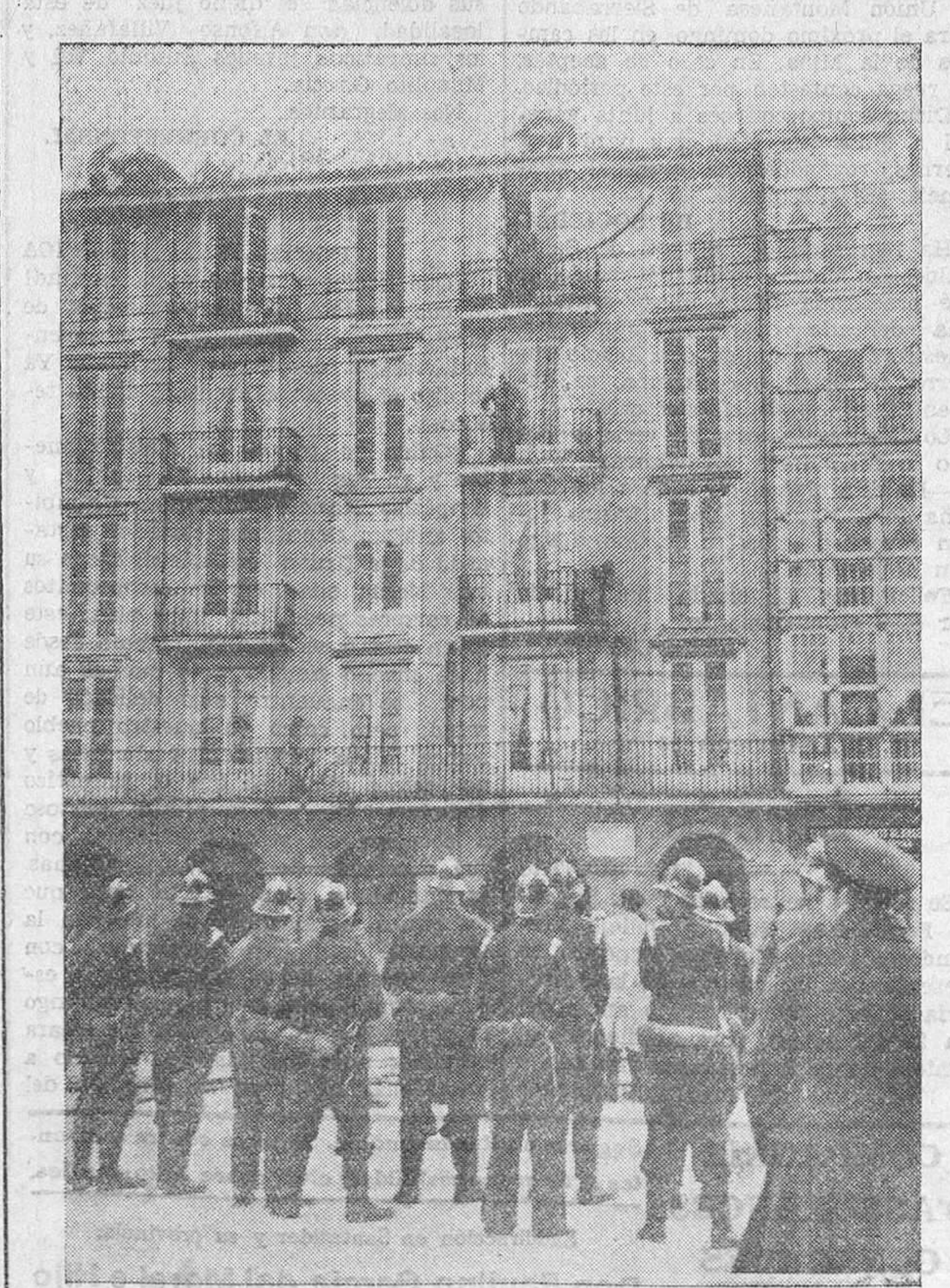
EL INCENDIO DE AYER. — La casa de la calle de Vargas donde se inició ayer un incendio, que fué cortado en seguida por la pericia de los bomberos.

Desde esta fecha hasta el día 20 del corriente se admiten en Secretaría propuestas para la elección de candidatos de esta Agrupación Socialista. Cada propuesta debe venir avalada con 20 firmas de afiliados, y cada grupo de veinte afiliados puede hacer hasta cinco propuestas. Como no ignoran los compañeros, estas propuestas, previo reconocimiento de las firmas por el Comité local, son elevadas al Comité provincial para conocimiento de todas las Agrupaciones, y en su día elegir, mediante votación, los que hayan de ser candidatos a diputados a Cortes. El plazo termina el día 20, a las ocho de la noche, hora en que comenzará la asamblea extraordinaria que para tratar de la cuestión electoral se celebrará en el salón de la Casa del Pueblo.