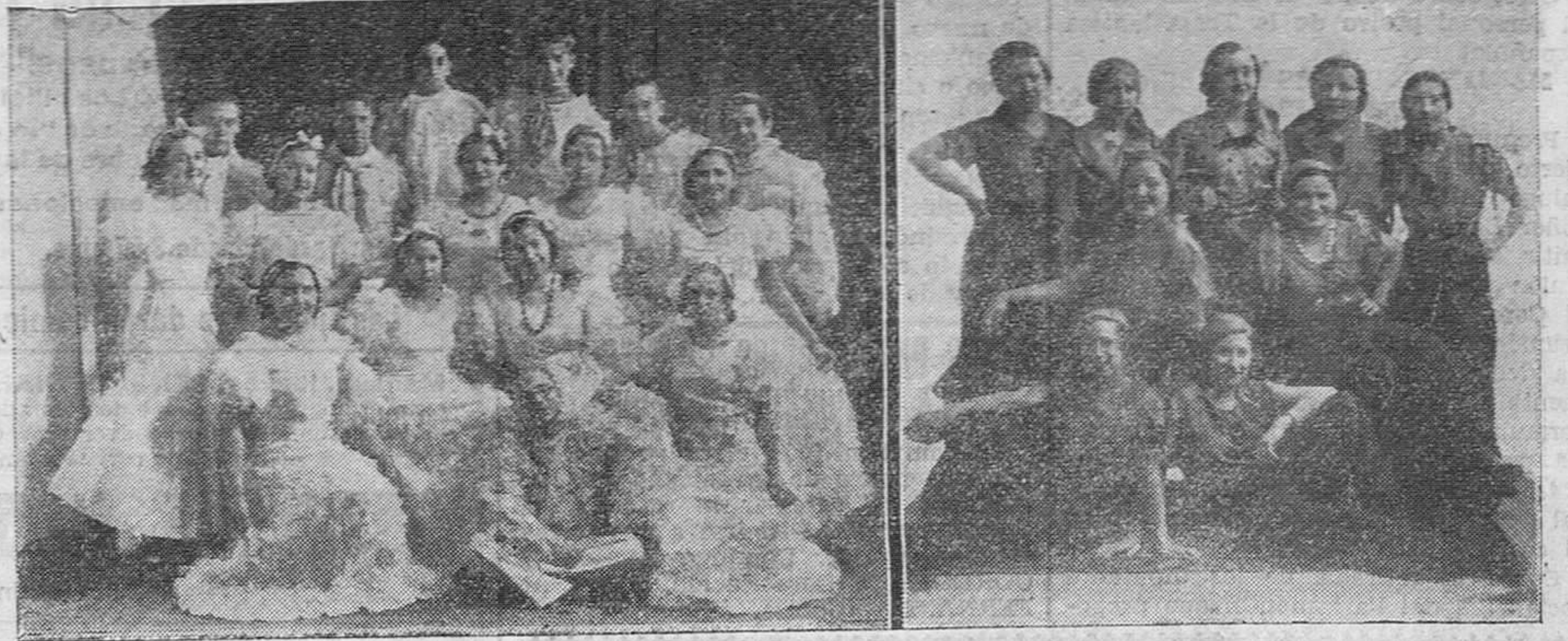
Distinguidas y bellas señoritas que han tomado parte en una función a beneficio del Asilo-Hospital de Torrelavega.

El tema que desarrollará el señor González-Camino será: «Una empresa de utilidad regional: El Centro de Estudios Montañeses».