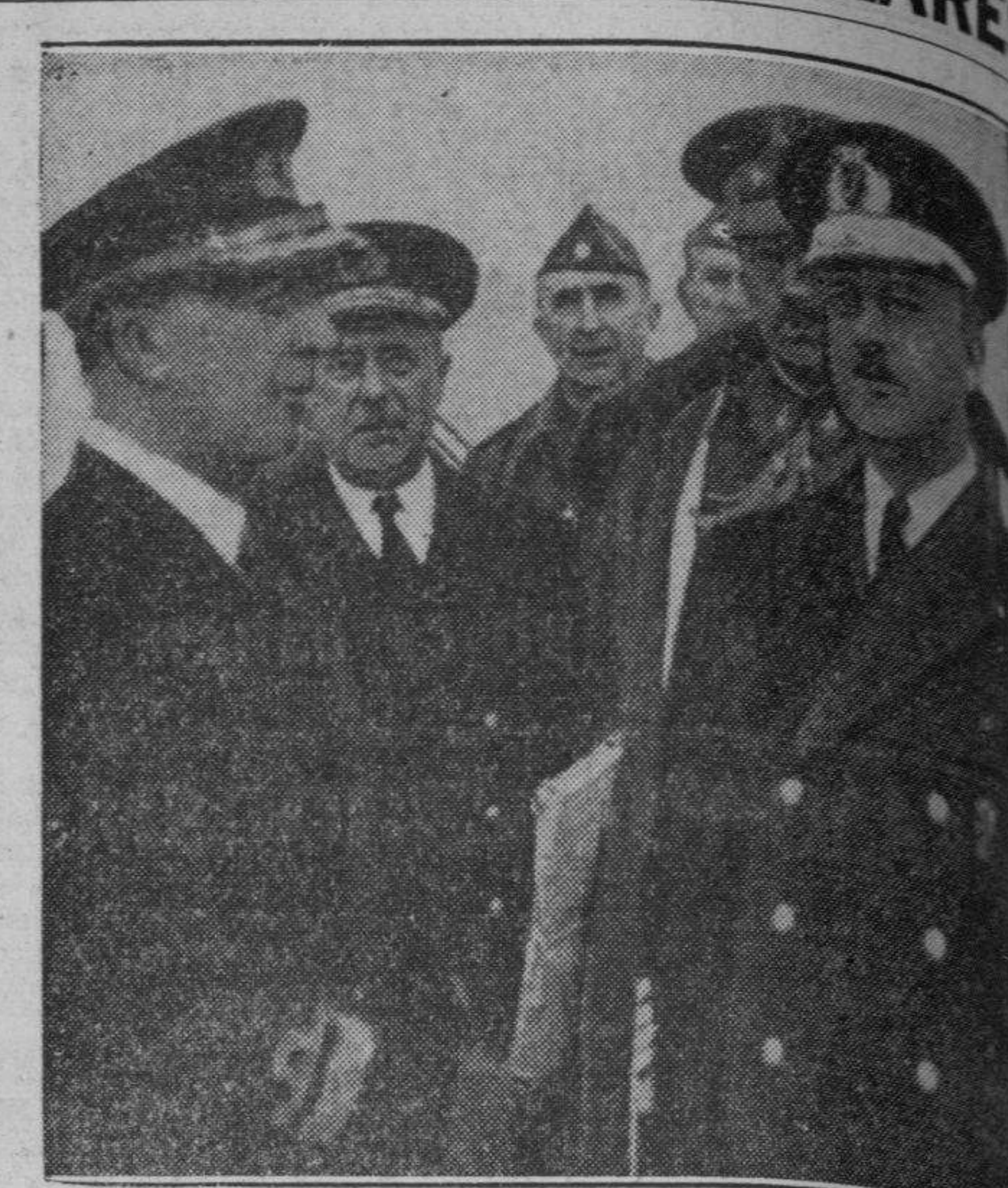
FRANCO INSPECCIONA LA ESCUADRA—El Generalísimo Franco revisó recientemente la escuadra nacionalista del Mediterráneo, como puede verse en la foto. El Generalísimo aparece sobre el crucero Canarias

pueblo en la plenitud de su ciudadanía, consciente, pulcra, ordenada y viril es lo que se advierte en este ambiente fraternal donde tan noblemente se ejercitan los derechos ciudadanos.