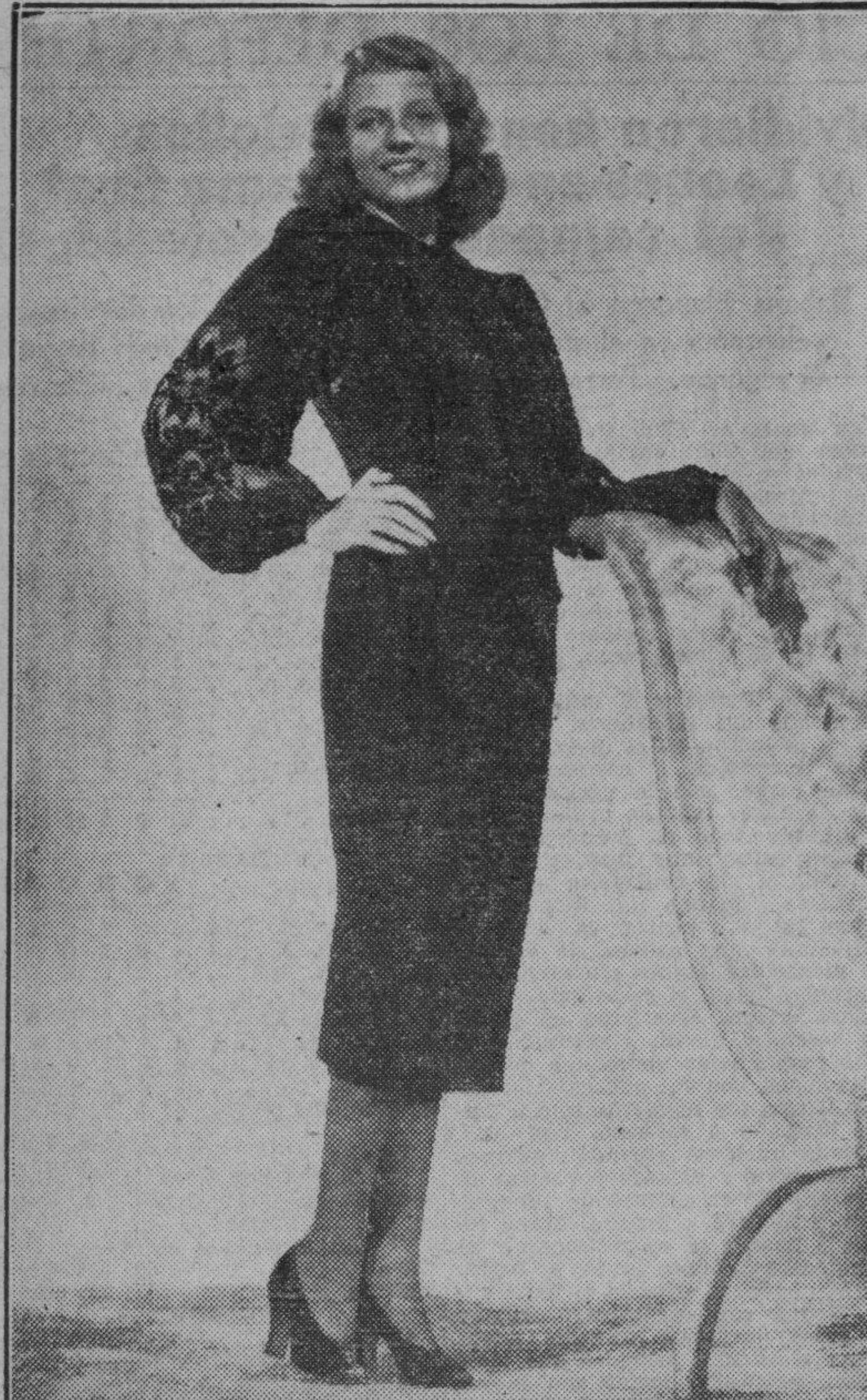
ARTISTAS DE HOLLYWOOD

La graciosa artista de la Compañía Columbia nos muestra un modelo de vestido de tarde, liso, en crepé negro, donde lleva como adorno único un bordado en las mangas.