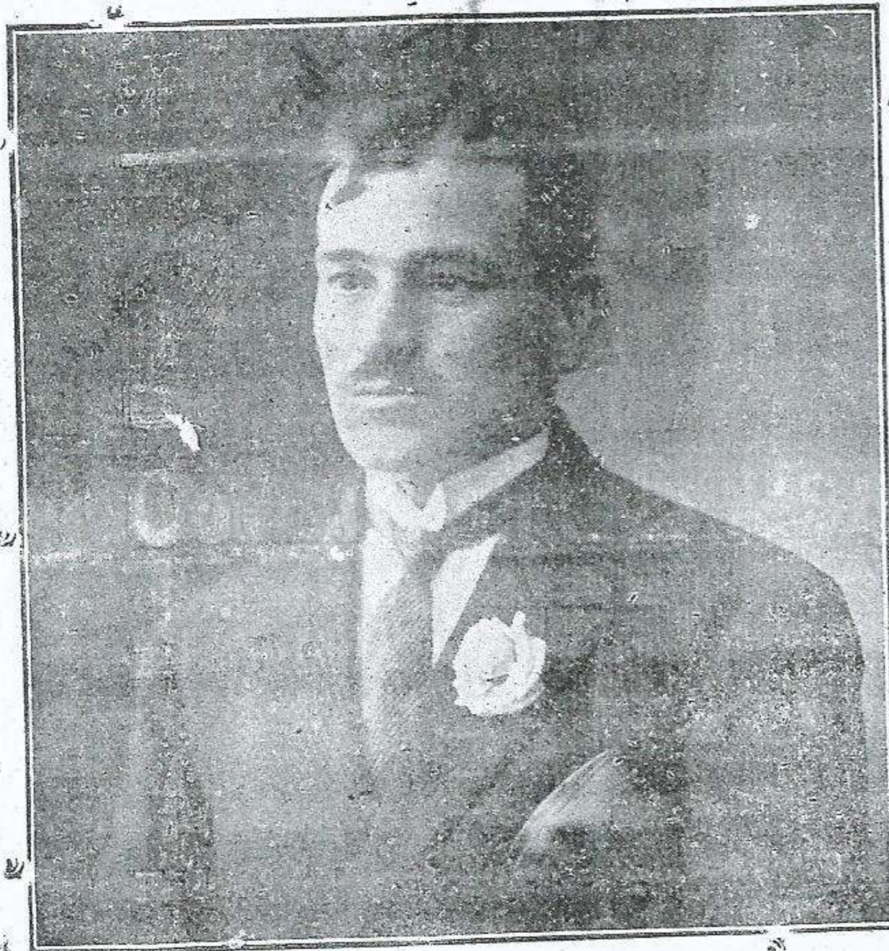
Representante del Centro Montañés "Liébana en la Argentina", en la provincia de Santa Fé.