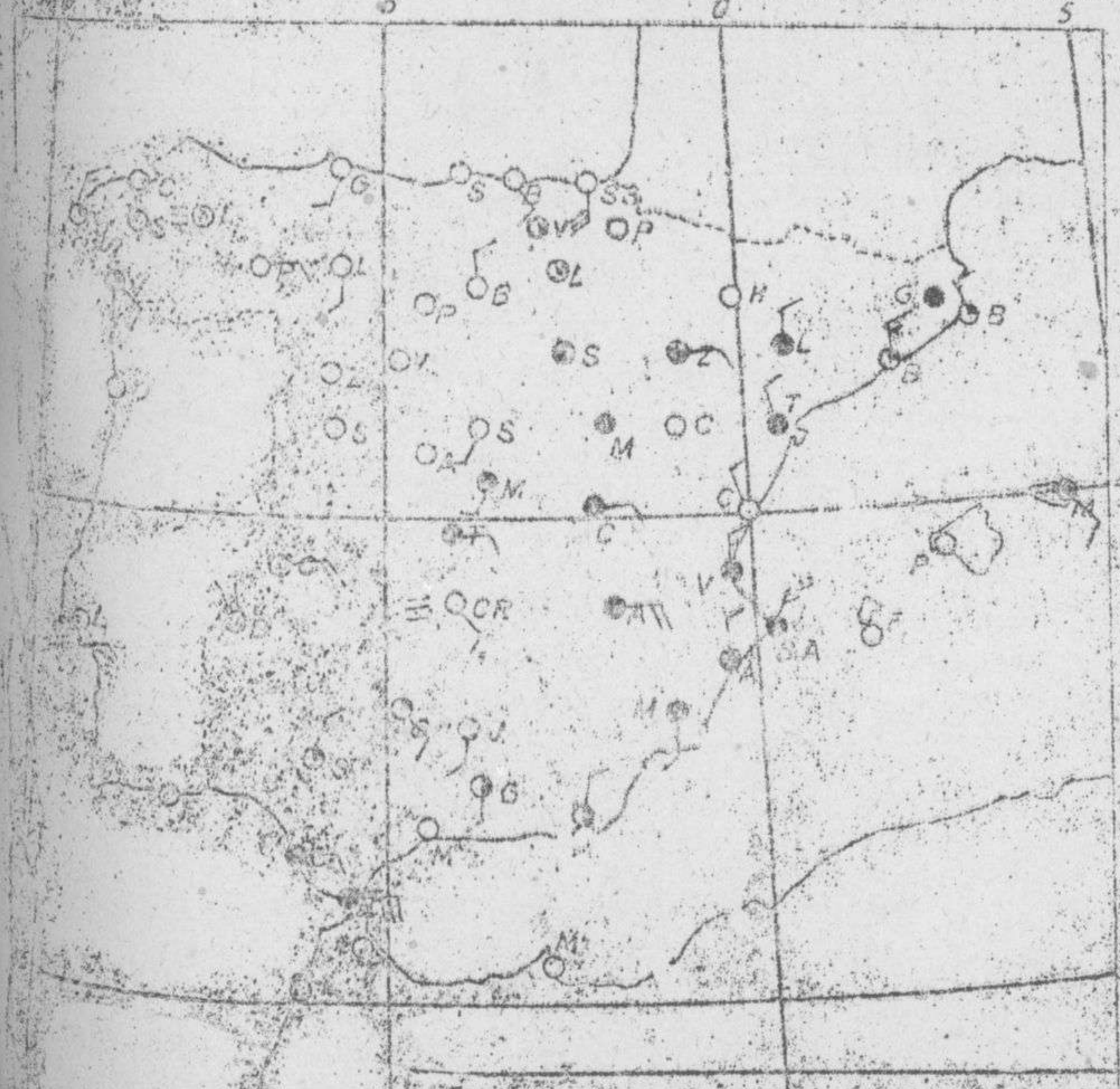
Estado del tiempo, variaciones de temperatura y zonas de precipitación en las últimas 24 horas