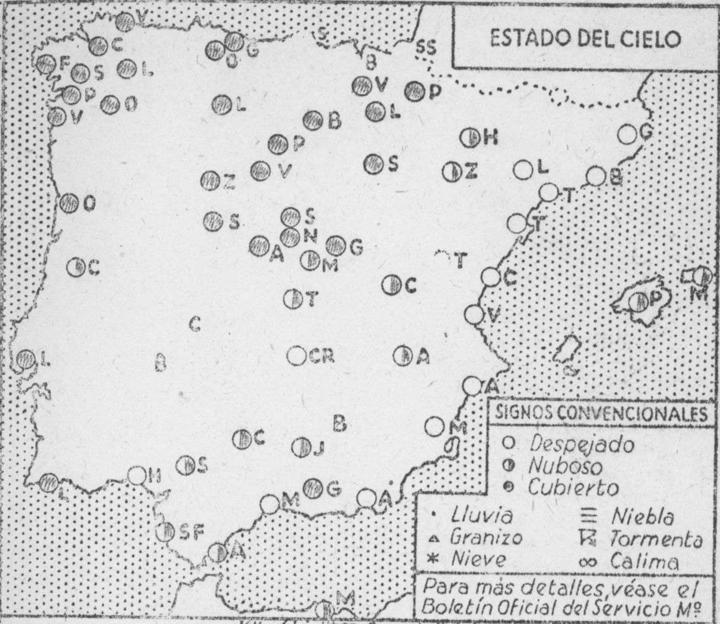
ESTADO DEL CIELO