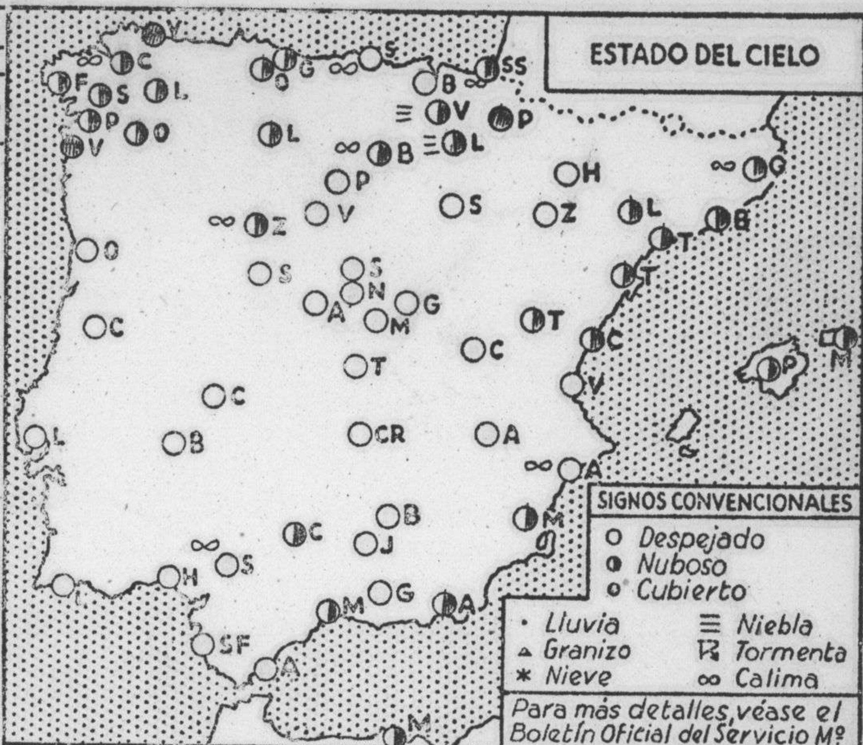
ESTADO DEL CIELO