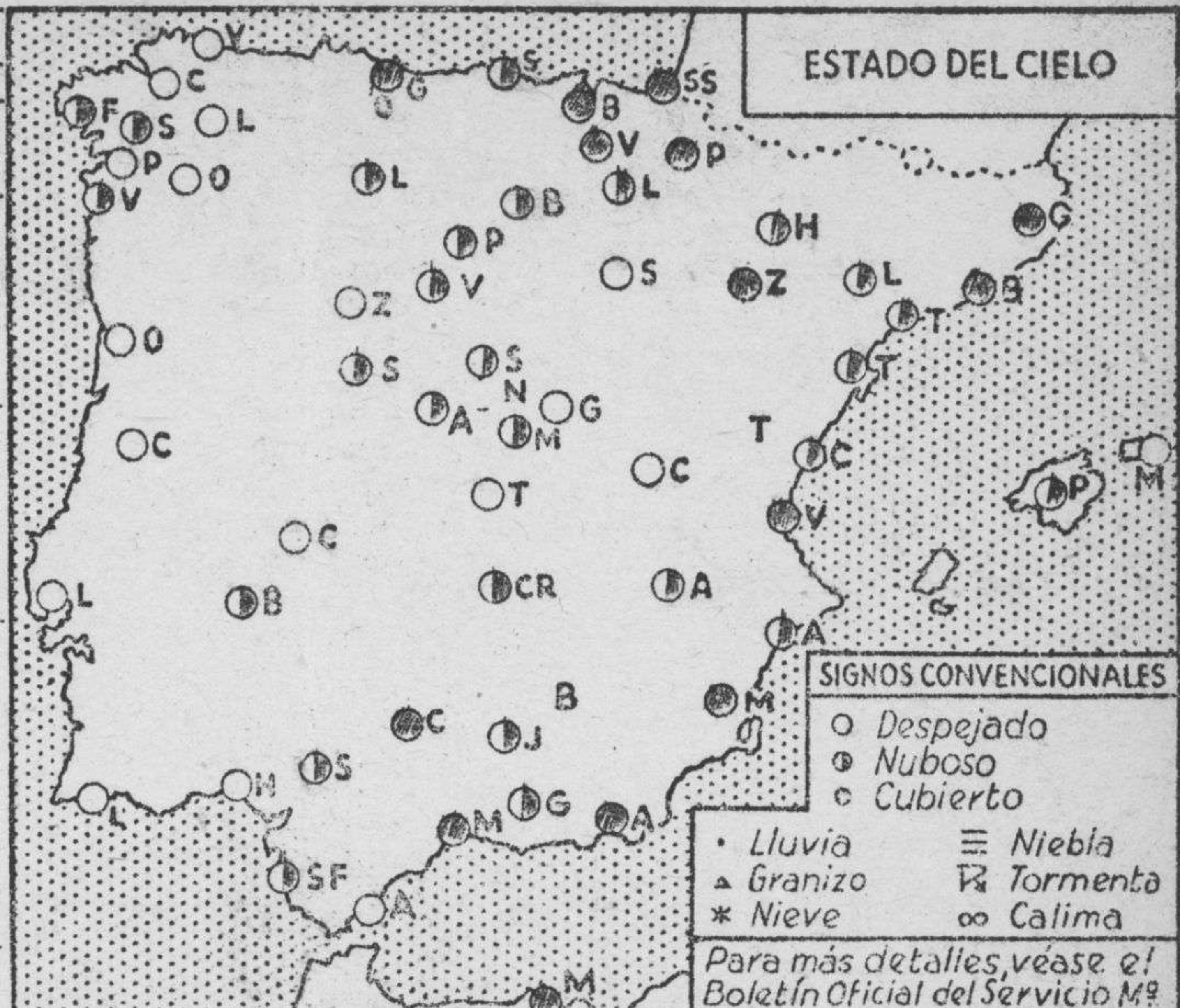
ESTADO DEL CIELO