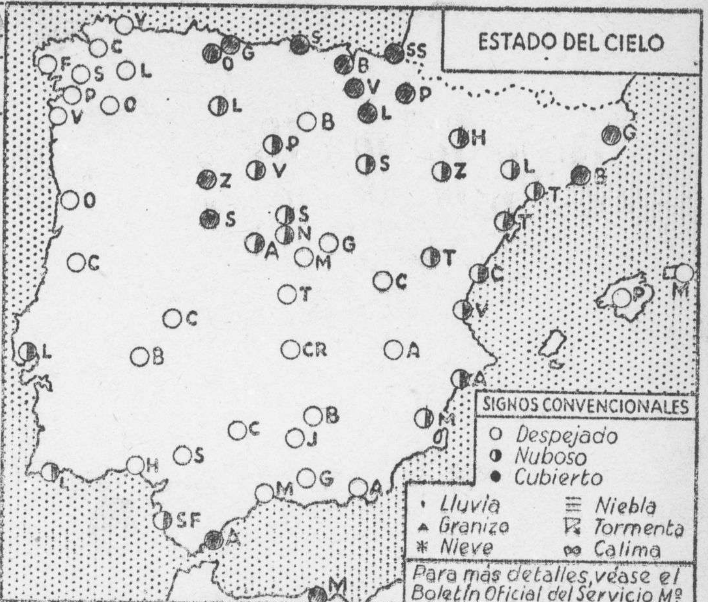
ESTADO DEL CIELO