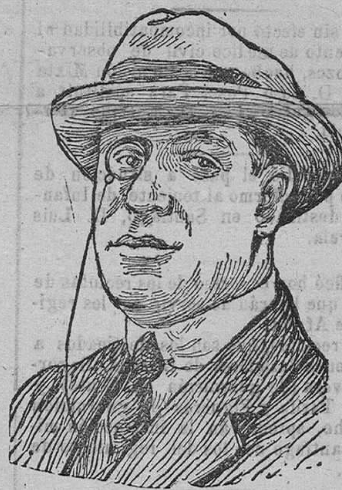
El ilustre novelista D. Antonio Hoyos y Vindel, que se encuentra gravísimo a consecuencia de una caída en el Metropolitano