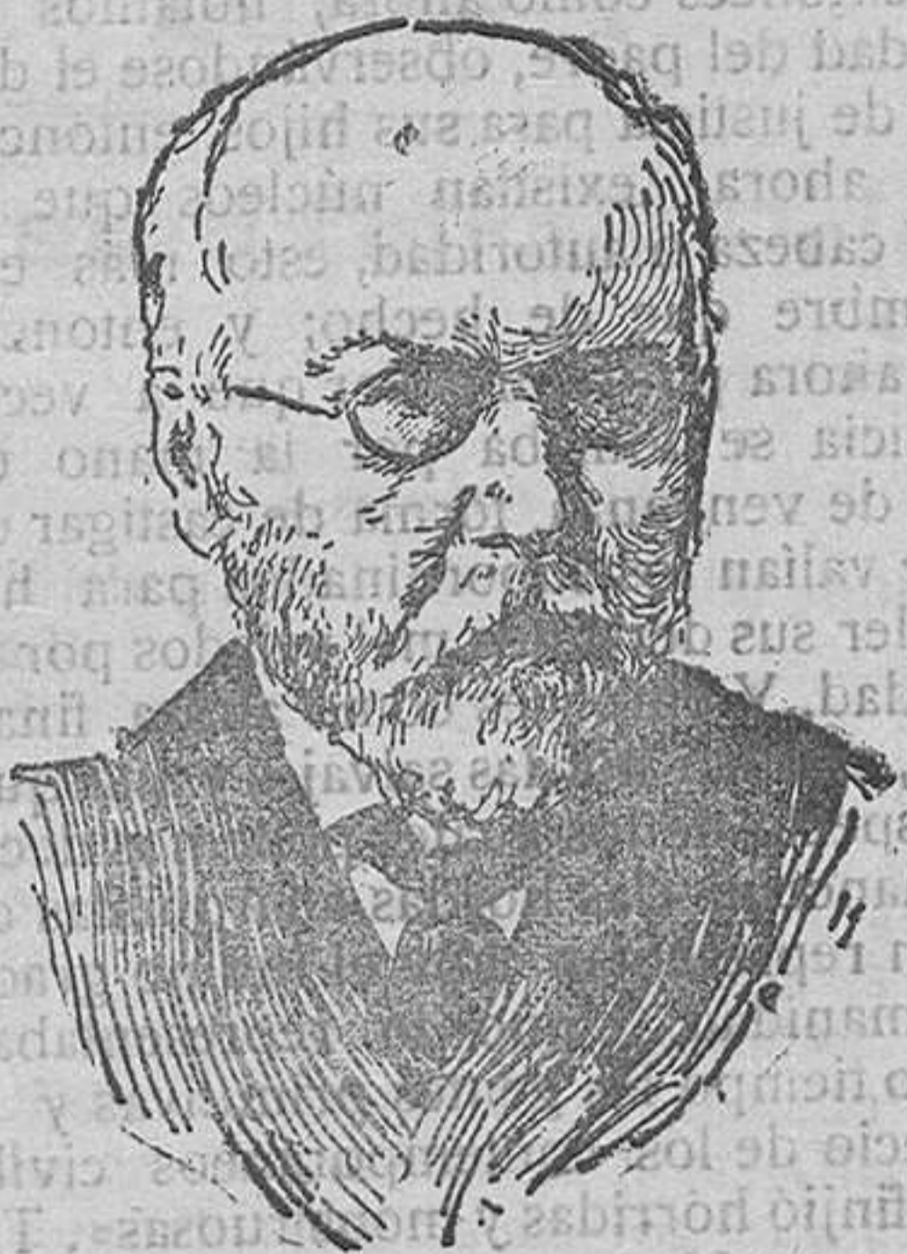
Sr. Conde de Hertling, canciller de Alemania.

Quinto. Regulación de toda aspiración colonial. La realización práctica del principio formulado por Wilson encontrará