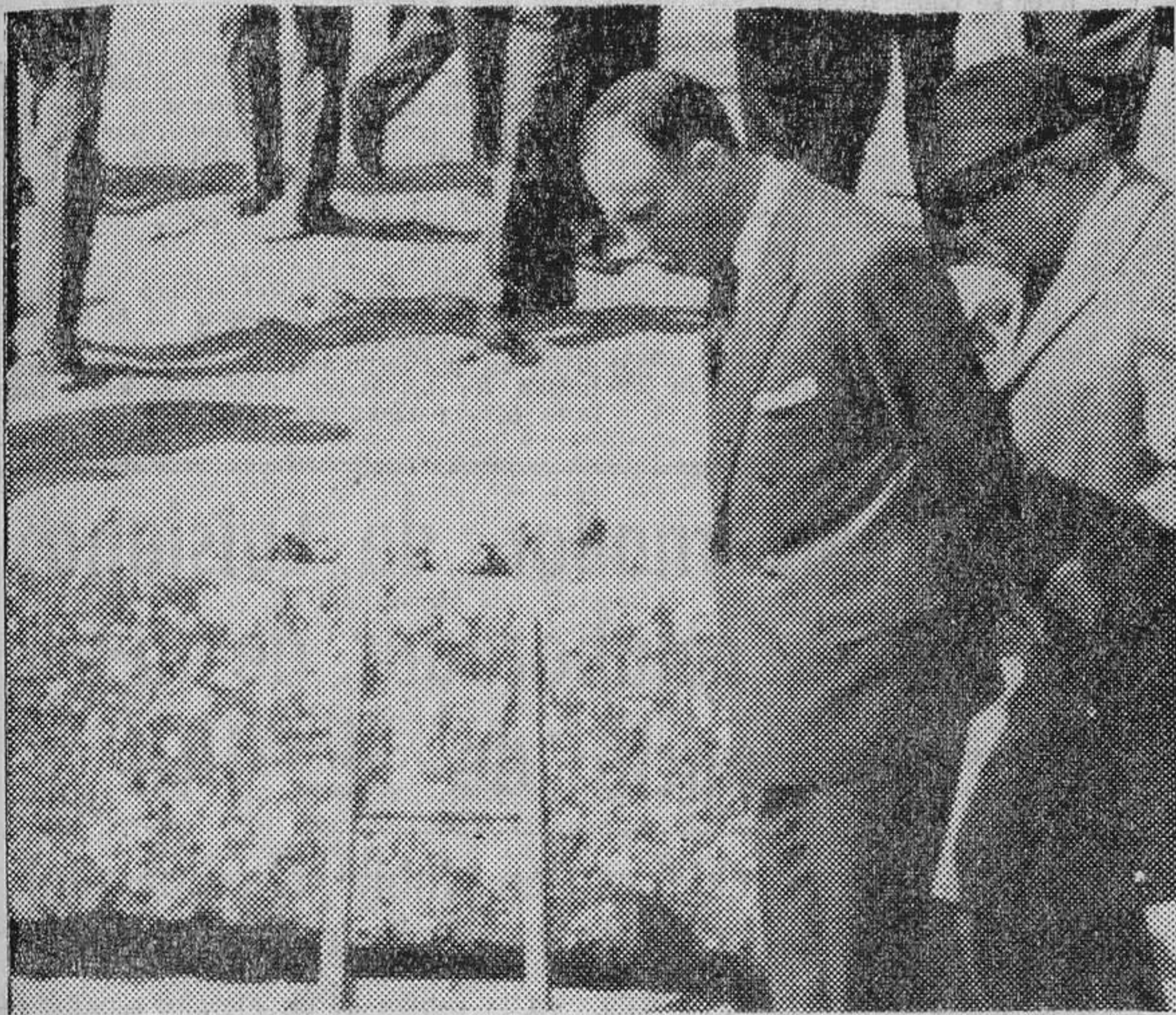
El ministro de Información y Turismo, don Manuel Fraga Iribarne, durante su reciente estancia en Sevilla, visitó la necrópolis romana de Carmona.

MARZO ROBLES NO RECONOCE AHORA LA AUTORIDAD DE LA ASAMBLEA Y SOLO APELA AL TRIBUNAL SUPREMO