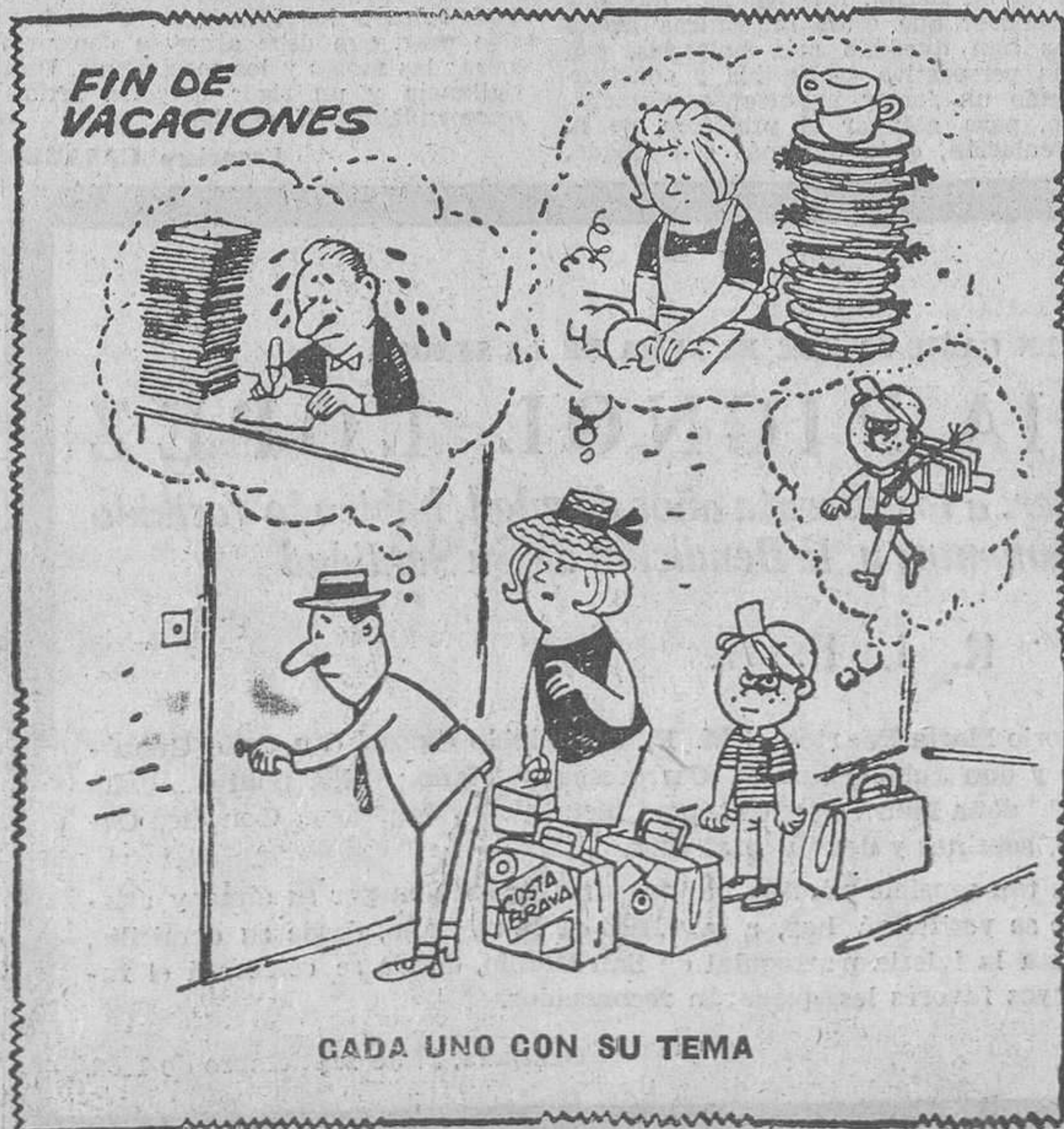
CADA UNO CON SU TEMA

Siempre con la garantía de precios de MAS BARATO QUE NADIE!