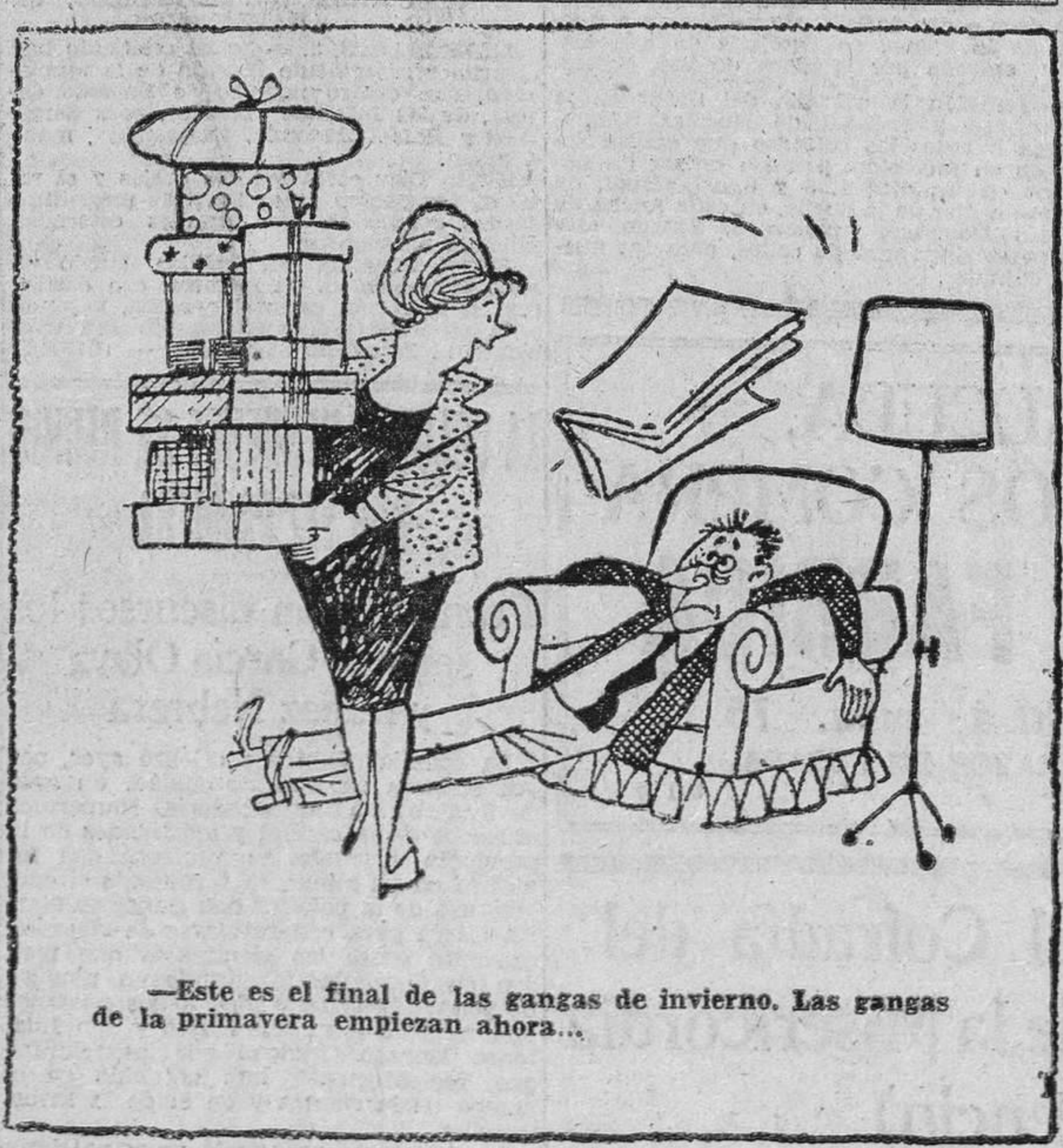
—Este es el final de las gangas de invierno. Las gangas de la primavera empiezan ahora...

PHNOMPENH (Camboya), 3.— Ha fallecido el rey Norodom Suramarit, de Camboya. Contaba sesenta y cinco años de edad. El monarca se hallaba enfermo desde hacía diez días. No ha sido fijada la fecha para el nombramiento de su sucesor. Al ser anunciada oficialmente la muerte del rey, fueron disparadas las tradicionales salvas de cañón. El finado monarca se educó en Saigón. Contrajo matrimonio con la princesa Kossamak Nearikeak, hija del entonces monarca reinante, Sisowath Monivang.