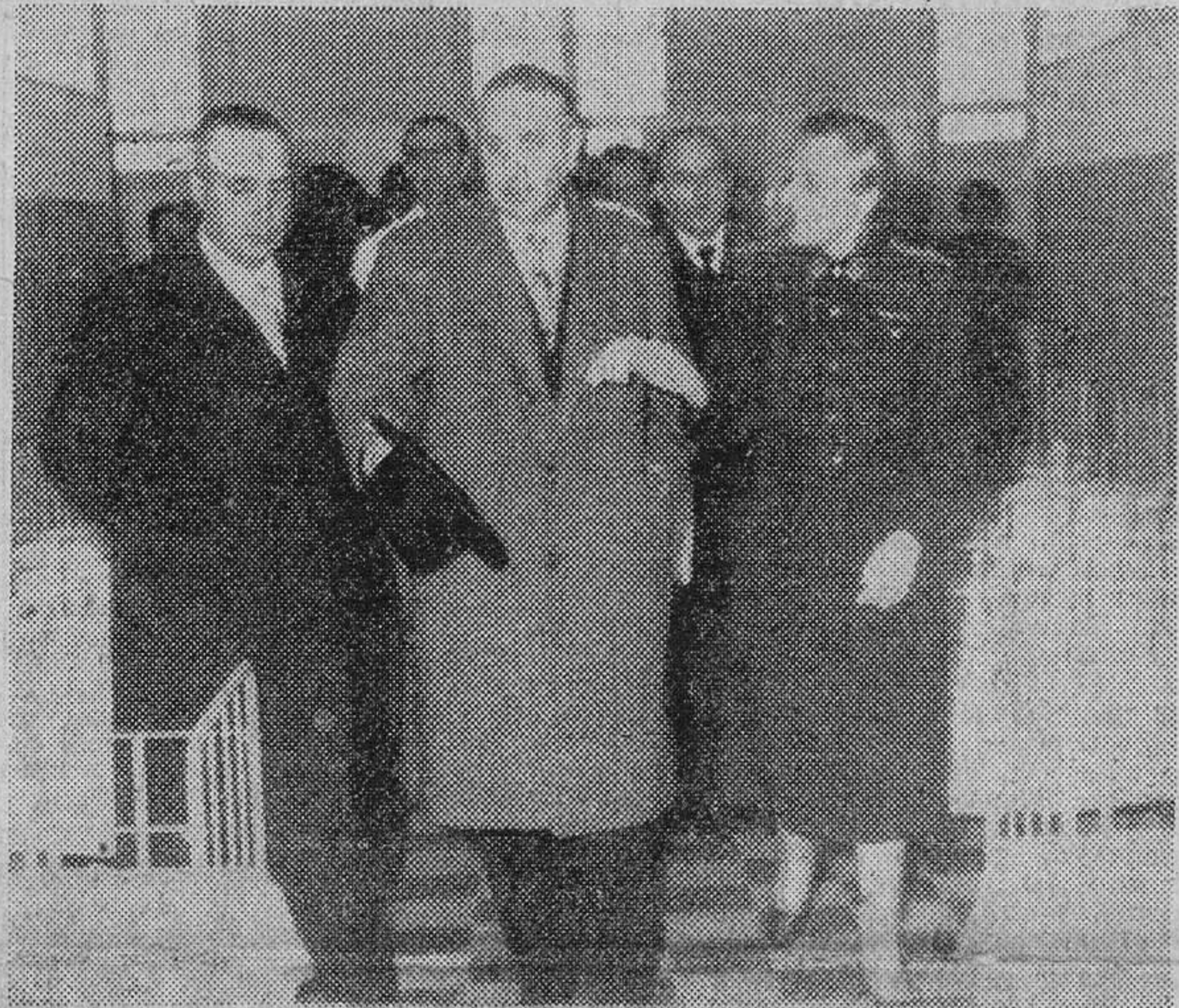
En la prisión de mujeres de las Ventas, el ministro de Justicia, señor Iturmendi, ha inaugurado el Centro Penitenciario de Maternología y Puericultura.