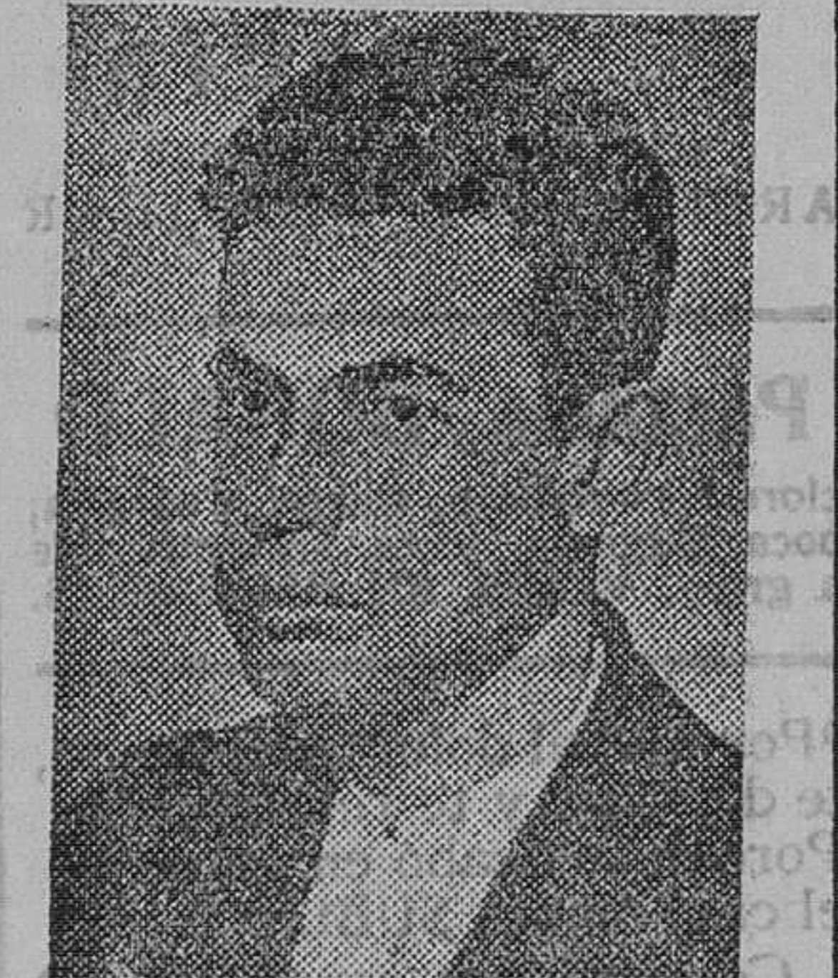
TORAL, el asesino del presidente electo de Méjico, que ha sido condenado a muerte por el tribunal del jurado mejicano