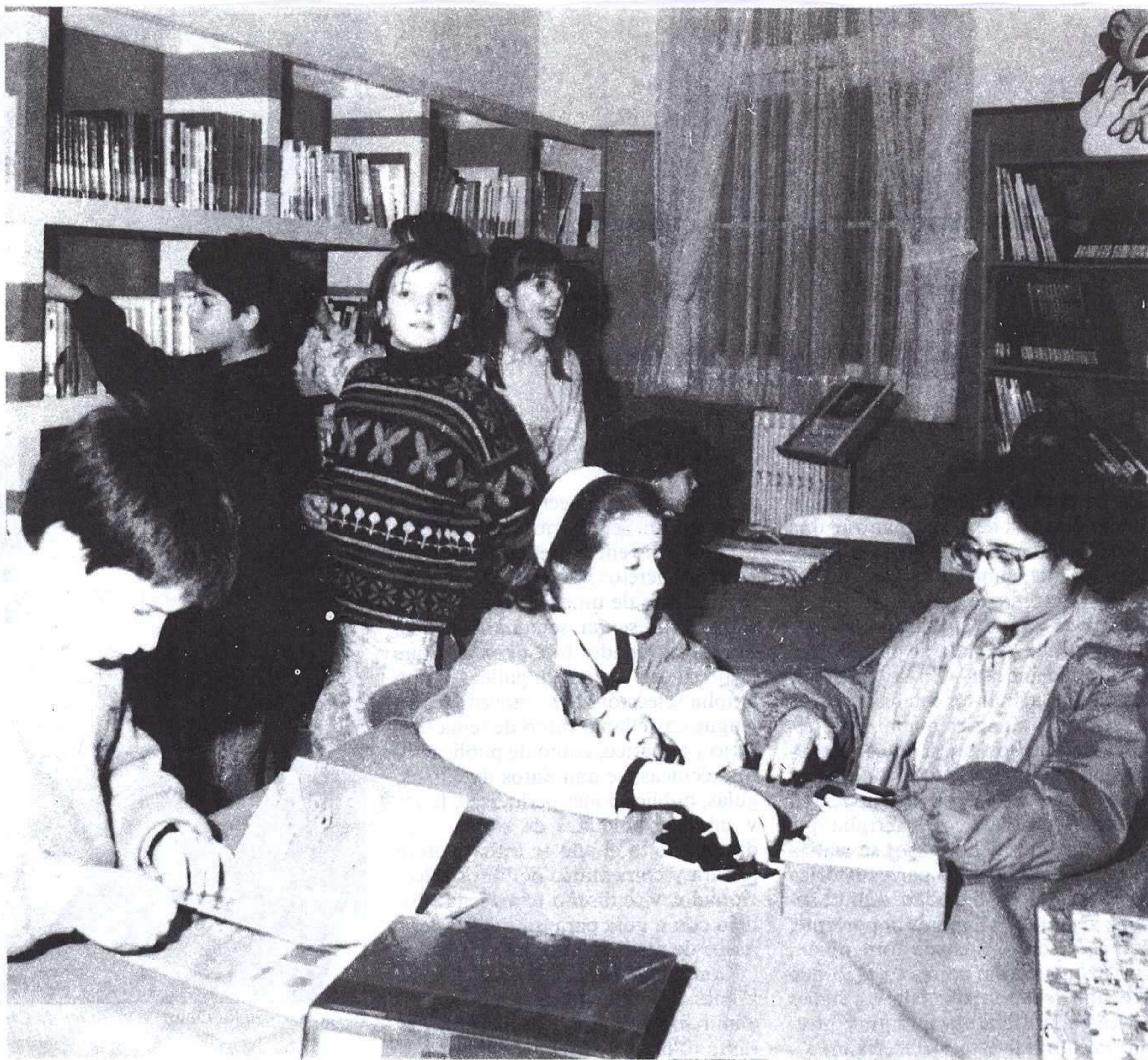
Sala de lectura de la Biblioteca Club 33.

bibliográfico puesto al día, que sea capaz de responder a sus intereses lectores y de información; pero creemos también que se necesitan lugares donde la gente más joven pueda reunirse y desarrollar actividades que propicien una ocupación del tiempo libre lo más creativo e interesante posible.