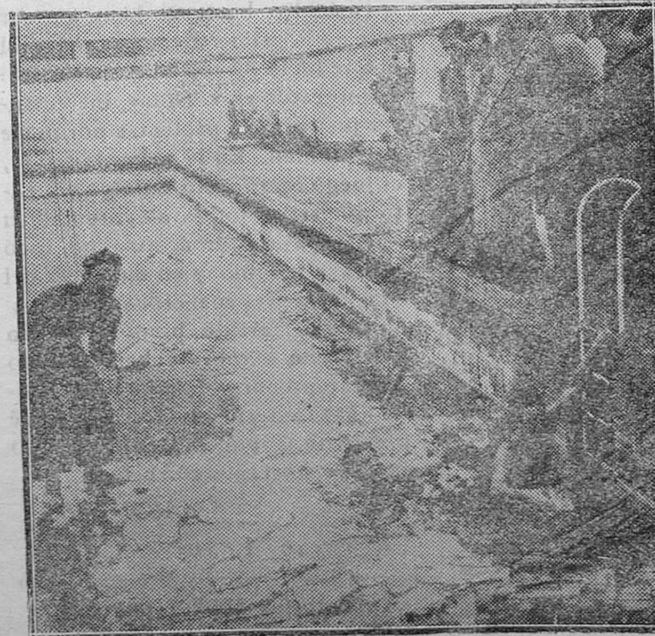
MADRID. — He aquí a unos valientes que se meten en el agua de una piscina en estos días de espantoso frío.