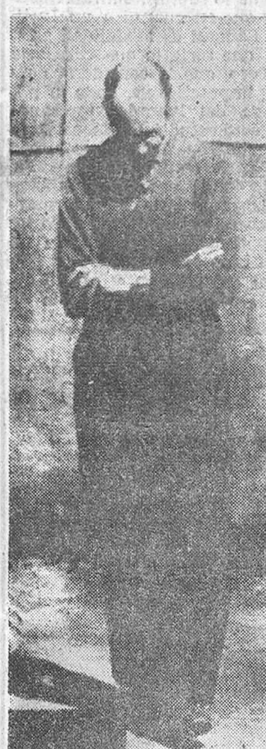
Los últimos momentos de Eichmann.

Jerusalén, 1. (Urgente). — Adolf Eichmann ha sido ahorcado en la prisión de De Beaulieu.—Efe.