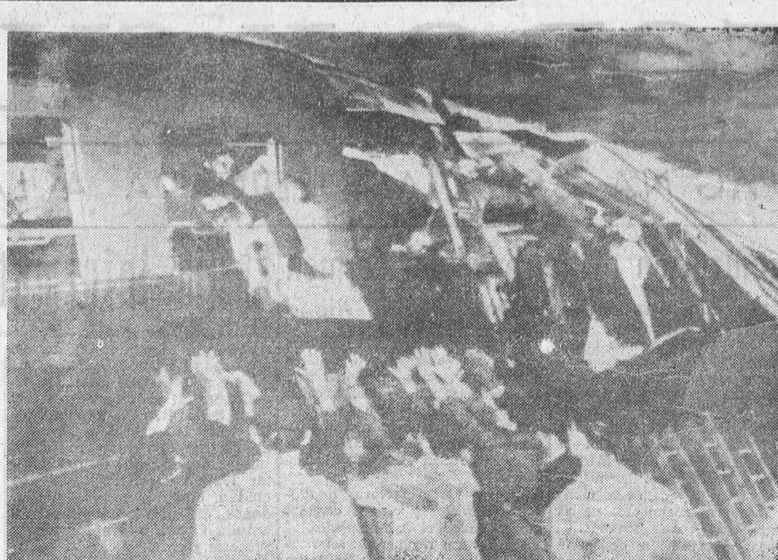
VOGHERA (Italia).—La fotografía muestra el momento en que las víctimas del choque de trenes son extraídas de los coches.