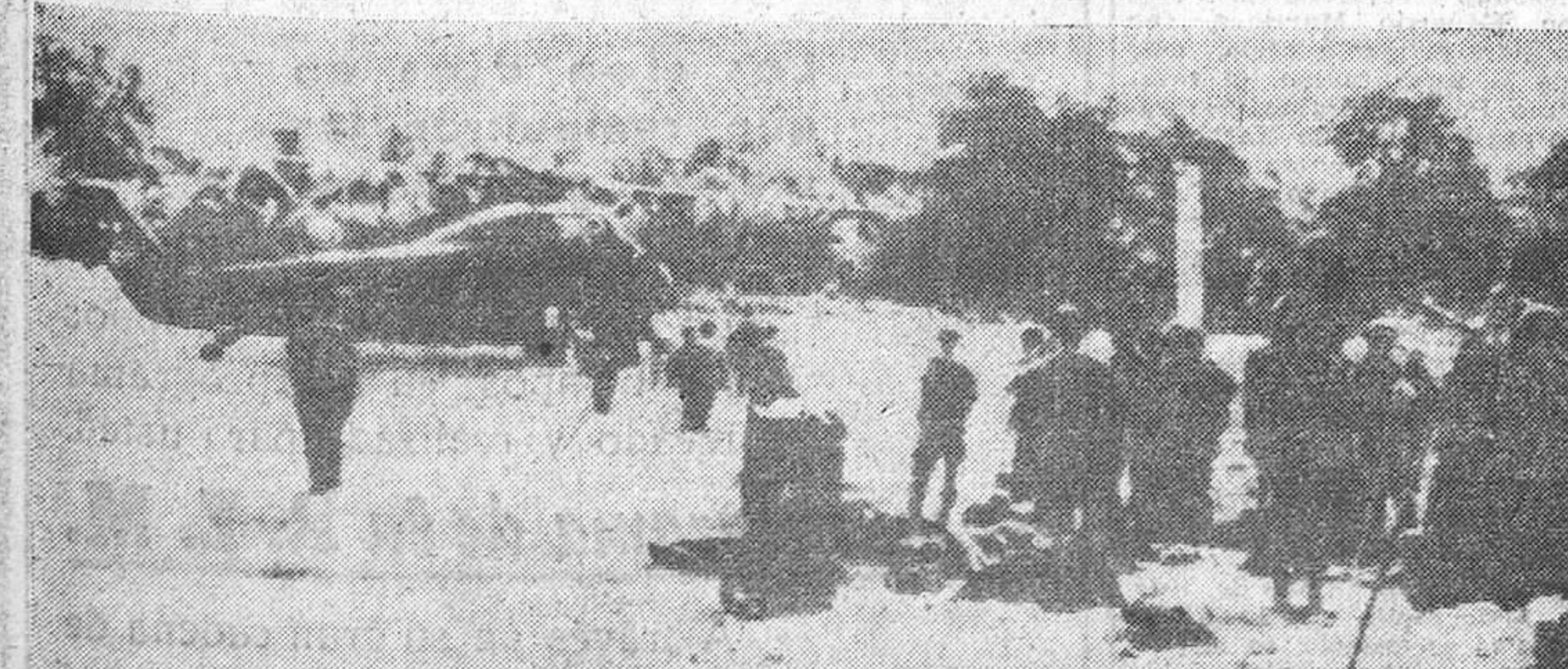
CHIENG KONG (Tailandia). — Fuerzas leales del Gobierno lao sismo, destacadas en una localidad cercana a la frontera tailandesa, fueron evacuadas a este país, ante la impetuosa ofensiva roja. Ahora los soldados esperan ser transportados desde Chieng Kong a Chiengrai, para desde allí volverse a Laos.

Naturalmente, detrás de los huelguistas, estimulándoles y envalentonándoles, estaba el partido comunista con su sempiterna estrategia de subversión, de alteración del orden público, de feroz lucha de clases. El juego liberal y el tinglado democrático sobre el que se apoya la actual política italiana son un caldo de cultivo especialmente adecuado para que en él florezcan continuamente estas maniobras comunistas.