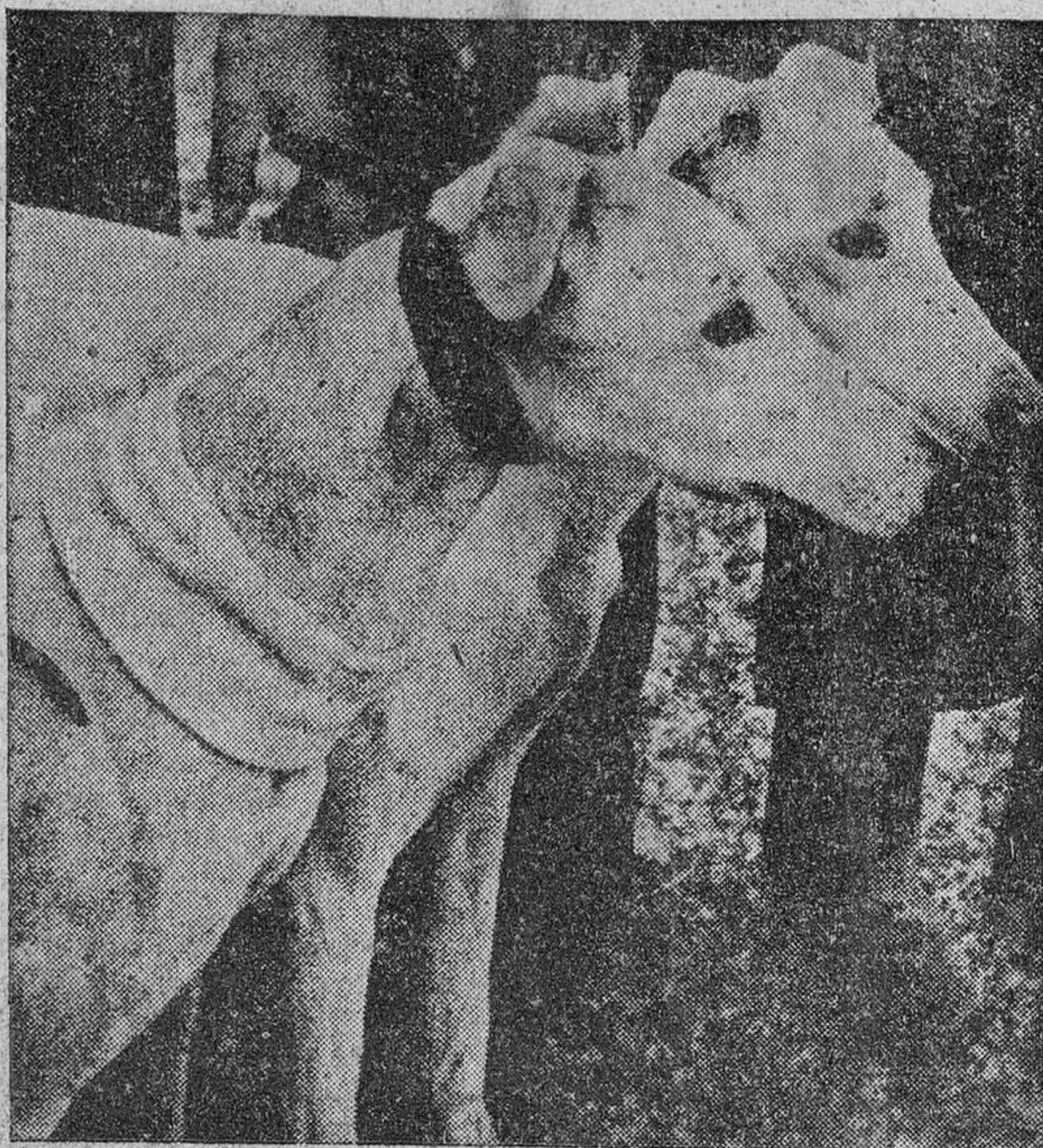
El domingo se corrieron las pruebas correspondientes al Campeonato de España de galgos. Presentamos a Farruca III y a Calesa, clasificados como campeón y subcampeón. Con Farruca III Albacete obtiene por vez primera la victoria.