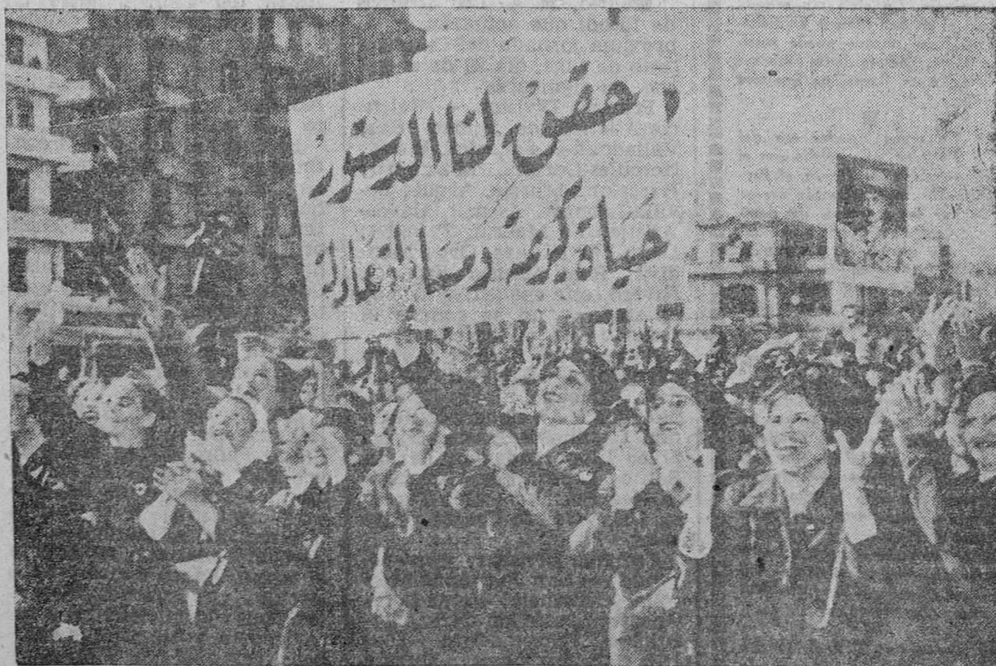
Cientos de miles de mujeres egipcias se reunieron ante el palacio presidencial de El Cairo para aclamar al coronel Nasser, jefe del Gobierno, por su decisión de conceder el voto a las mujeres.

SEGUNDO ANIVERSARIO.—Rogad a Dios en caridad por el alma de la señora