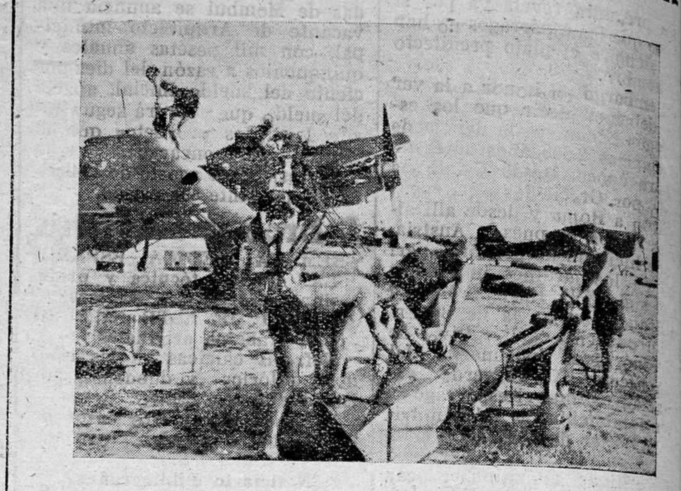
Los «Stukas», pesadilla de Inglaterra. En un aeródromo improvisado en el Norte de Francia una escuadrilla alemana de bombardeo en picado se prepara para un vuelo sobre los centros industriales ingleses