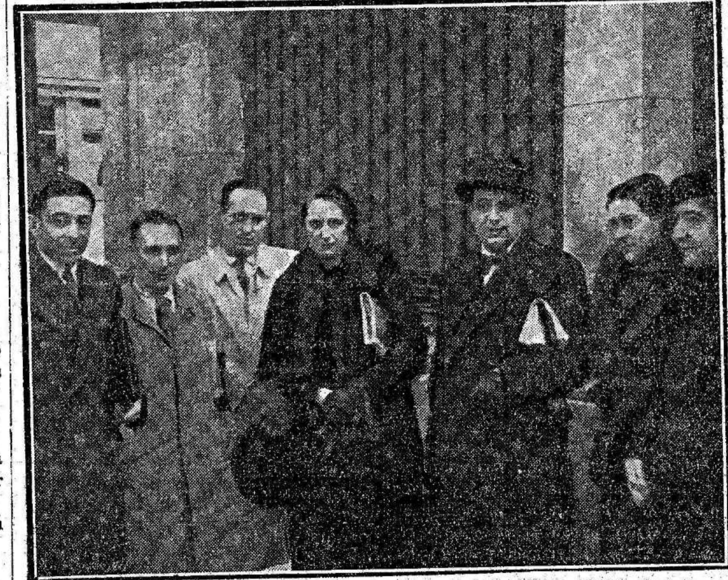
Para solicitar nuevamente la libertad de Thaelman, al cumplirse el tercer aniversario de su detención, una nutrida Comisión de abogados y diputados ha visitado al embajador de Alemania en Madrid

Se supone que se tomó el total contenido del bote de cianuro.