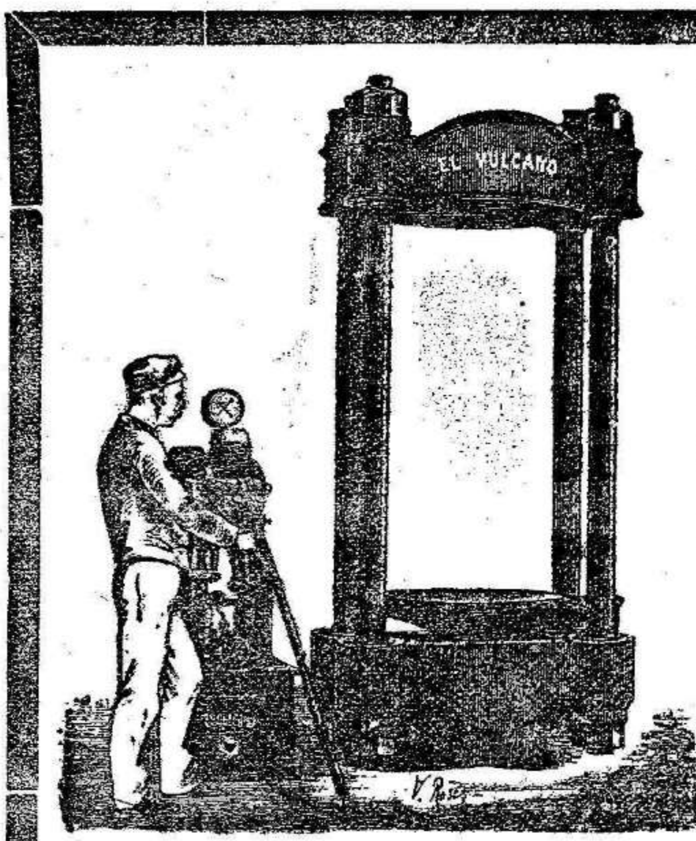
OFICINAS: P. PELOTA, 6. TALLERES: C. ORILLA DEL RIO, 16.

ESPARTO.—Muy buena clase, para hacer estera y para las matanzas, seco, se vende á 28 reales el quintal; en la calle del Conde, núm. 5, frente á la iglesia de la Compañía. 8-2