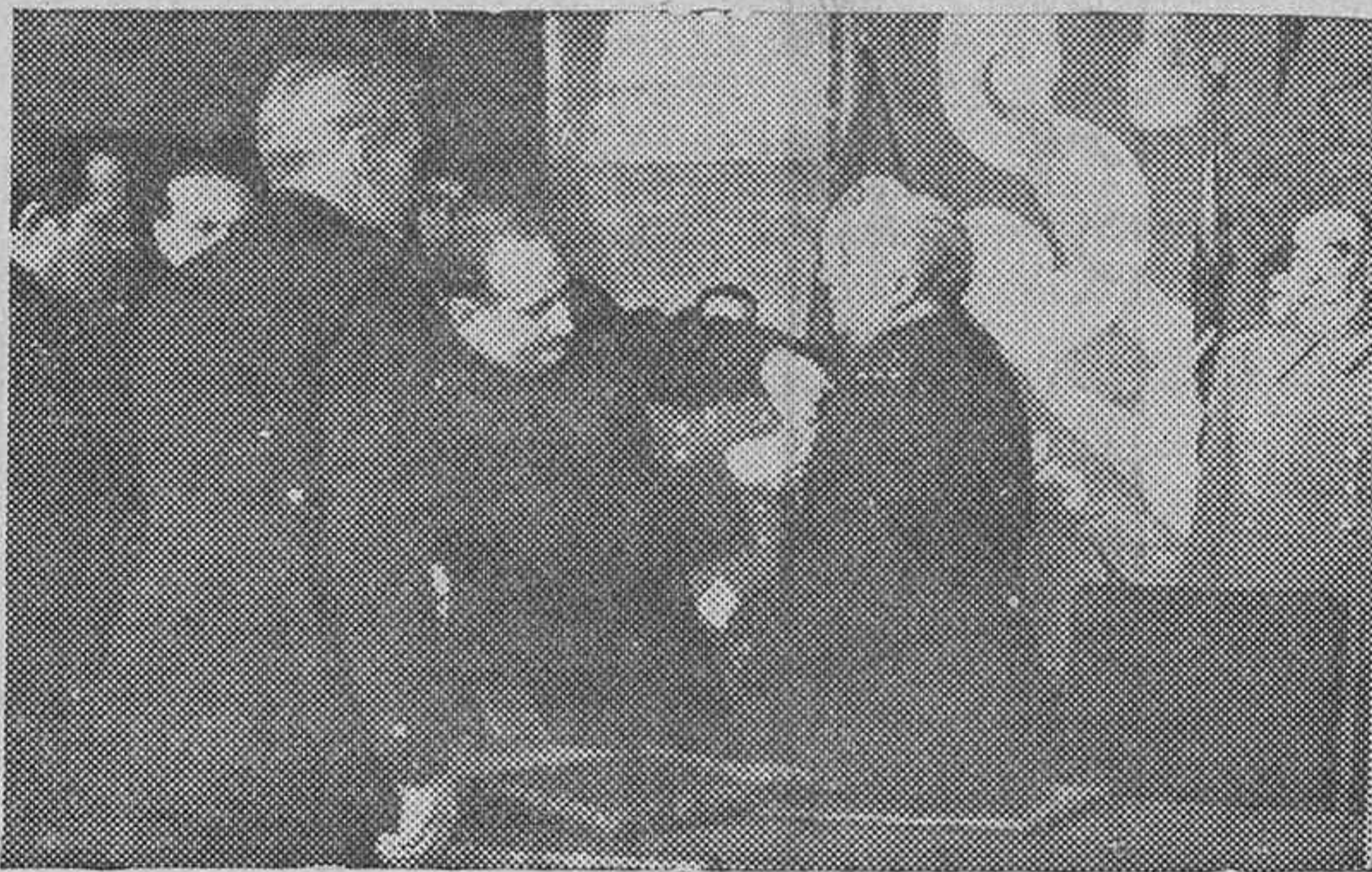
El Caudillo en su discurso de clausura del IV Consejo del Frente de Juventudes y en la imposición que se le hizo por el Ministro Secretario de la Medalla de Oro de la organización.

Madrid.—El Consejo Nacional del Frente de Juventudes cumplimentó a Su Excelencia el Jefe del Estado y Generalísimo de los Ejércitos en el Palacio de El Pardo y le hicieron entrega de un obsequio. Terminada la visita, una escuadra del Frente de Juventudes desfiló ante Su Excelencia.