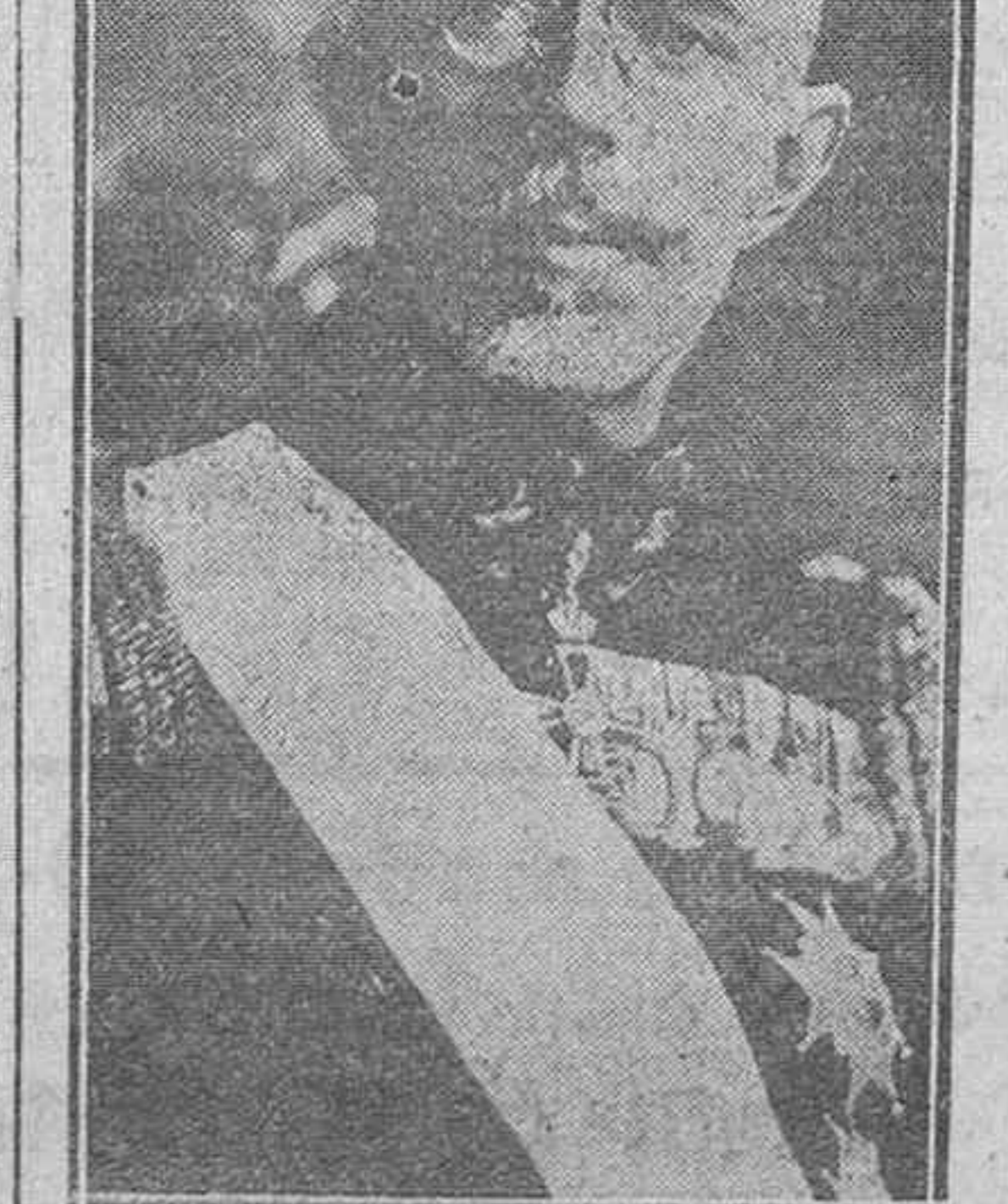
El Rey Gustavo de Suecia, cuyo discurso sobre la neutralidad sueca en el caso de Finlandia ha producido gran de sensación en su país.

Roma.—Bajo la presidencia del P. Rector de la Universidad Católica de Milán, se han celebrado en la mañana de hoy Juntas por la Academia de Ciencias Pontificia, en conmemoración y homenaje a Su Santidad el Papa Pío XI. (DNB).