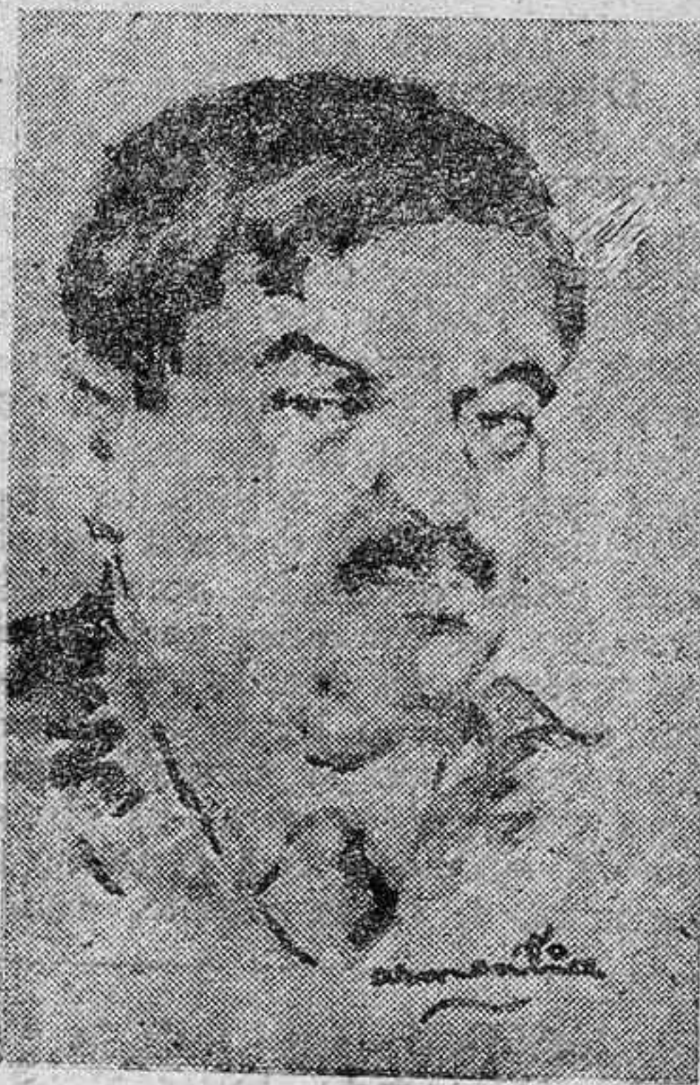
Pierre Laval, nombrado por el Mariscal Pétain, como sucesor inmediato suyo en caso de fallecimiento.

Se pone en conocimiento de todos los excombatientes de esta Provincia, que próximamente se han de celebrar oposiciones de Aspirantes en la Sucursal de Madrid del Banco de Bilbao, cuyas oposiciones se celebrarán en esta Plaza. Plano de admisión de instancias, 9 días a contar de la publicación de este anuncio. Edad, 16 a 28 años. Para más informes en esta Comisión, sita en Prado, 9, primero.