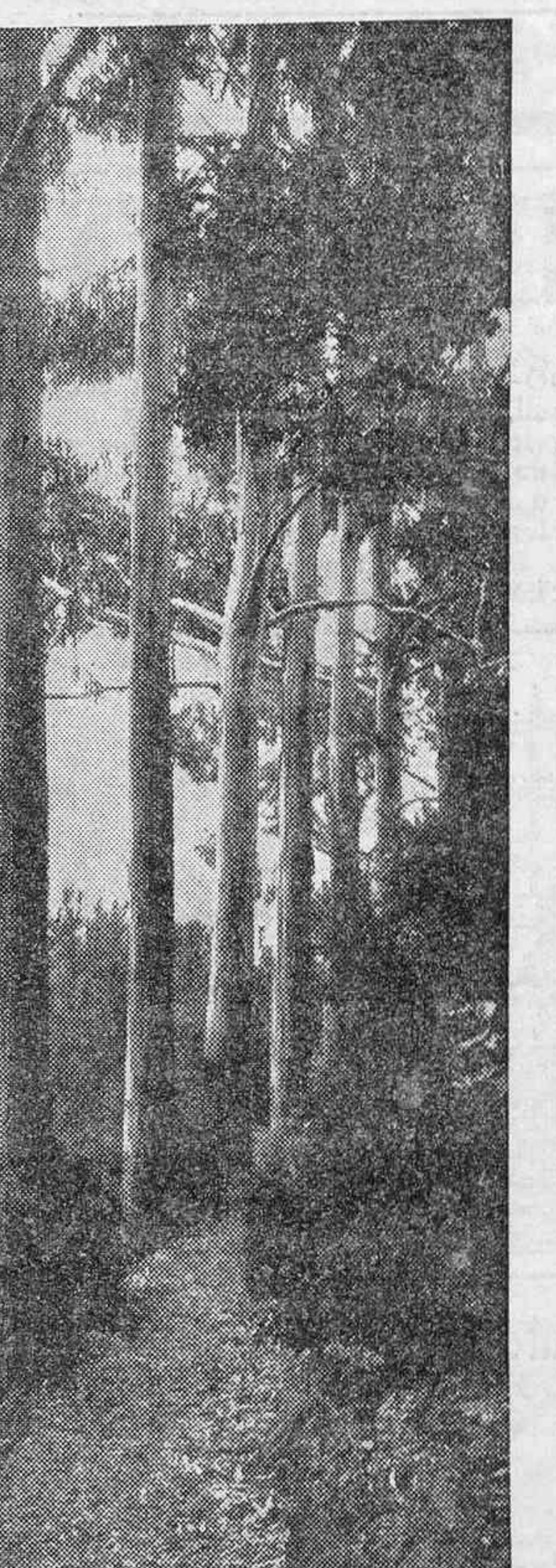
"Bosque centenario, de frescas umbrías, de frondosos laureles, todo en él son tradiciones y recuerdos, ecos y aromas de la tierra..."