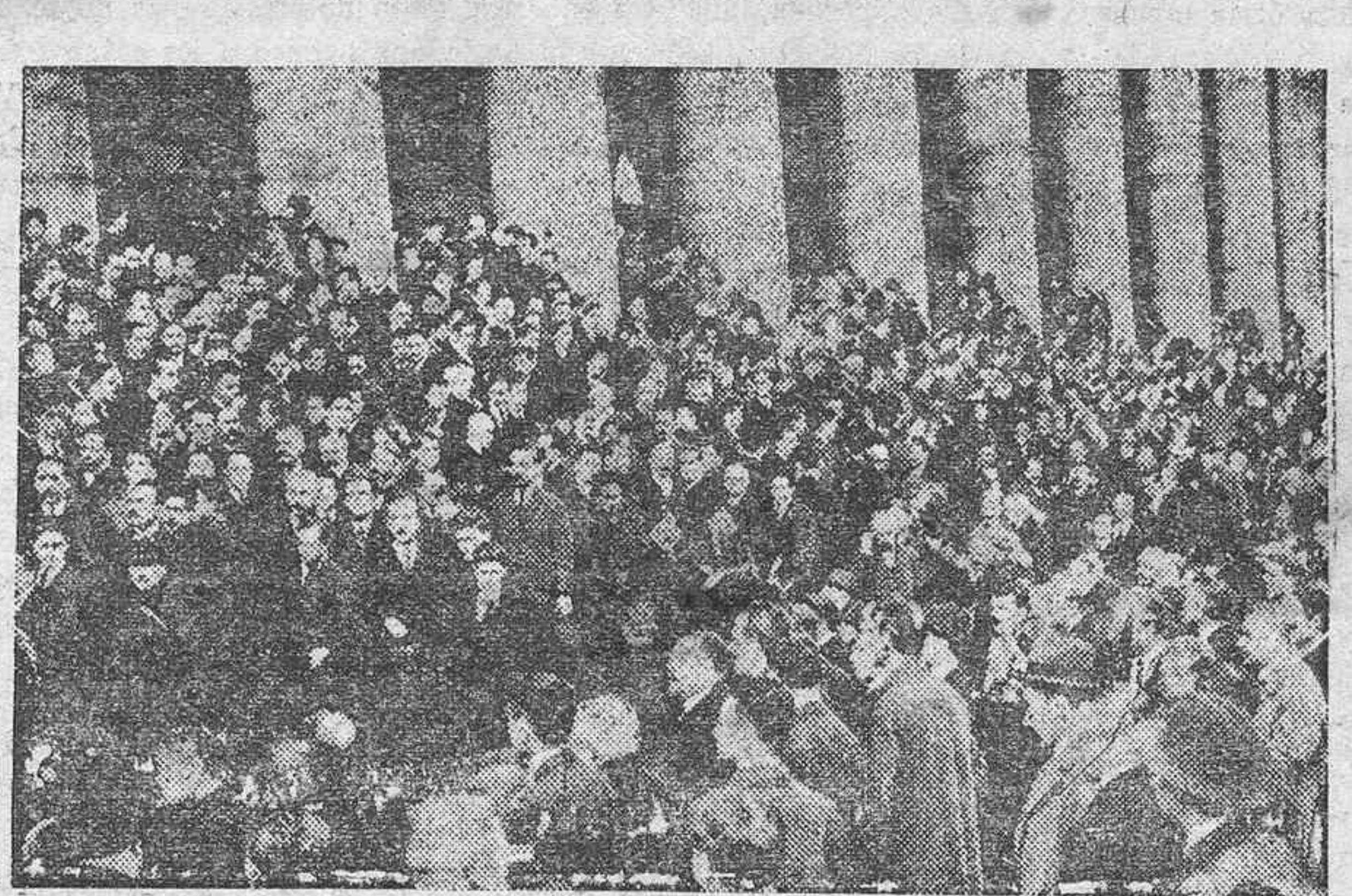
Aspecto que presentaba la Bolsa de París en uno de los días en que llegó el franco a su mayor descenso