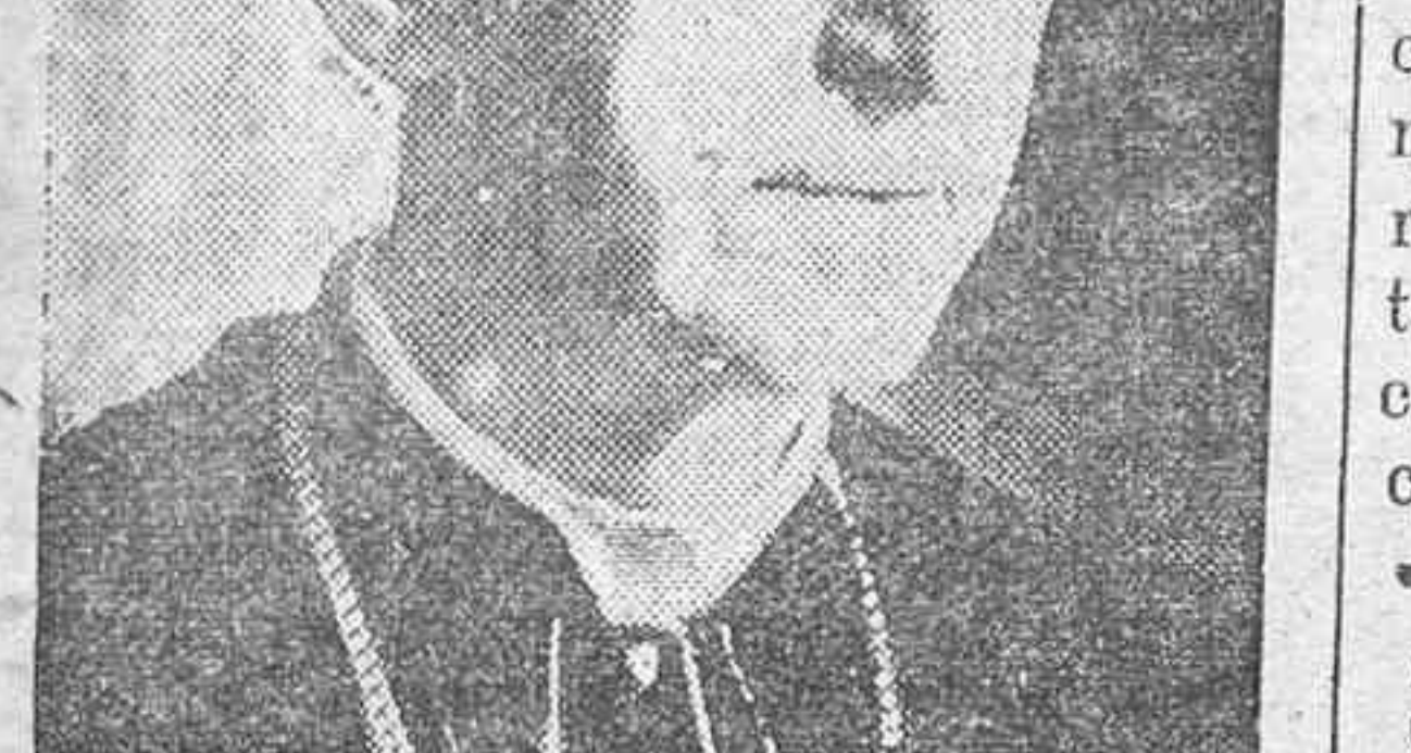
FIGURAS DE ACTUALIDAD.—El célebre cardenal Mercier, que ha sido sometido a una grave operación quirúrgica.

Obras municipales Según hemos sabido, por cuenta de nuestro Municipio se están efectuan-