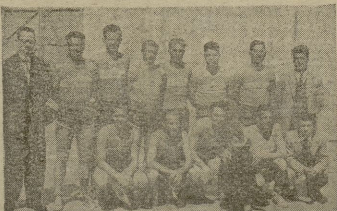
Equipo del «Hispania»