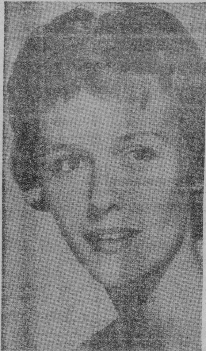
"Guapa porque sí; y ná má, que con eso hay bastante", diría un castizo. Guapa es, en efecto, Virginia Mac Kenna, que ha protagonizado la película "El mar cruel".