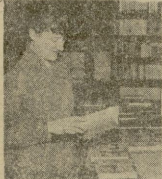
La editorial Moll prepara diversas novedades.

Y, para que no puedan pecar por falta de noticias concretas, he aquí que, con algunos días de anticipación —la Fiesta del Libro se celebra el 23 del presente mes—, hemos hecho un recorrido por nuestras editoriales y visitado algunos librerías que nos han hecho partícipes también de sus proyectos.