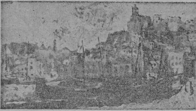
"Ibiza", óleo de Salvador Montesa que figura en la Exposición Montesa-Victoria, en Galerías Quint