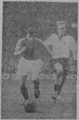
Posipal, medio volante de la selección alemana de fútbol que el próximo día 28 se enfrentará al equipo español en el campo de Chamartín