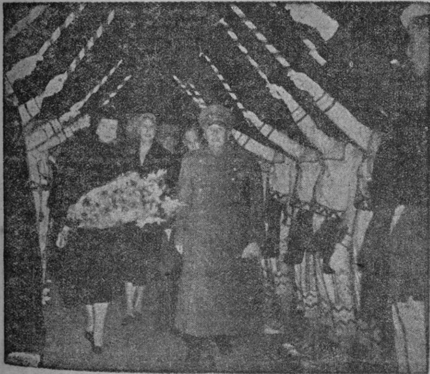
Bajo el arco triunfal que forman los “dantzaris” pamplonésicos, Sus Excelencias el Jefe del Estado y Señora se dirigen al altar de San Fermín, poco después de la llegada del Caudillo a la capital navarra