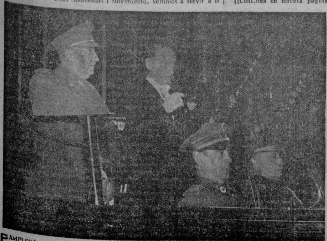
PAMPLONA. — S. E. EL JEFE DEL ESTADO EN COCHE DESCUBIERTO Y ACOMPAÑADO DEL ALCALDE DE LA CAPITAL, SE DIRIGE A LA CATEDRAL. DURANTE EL TRAYECTO S. E. RECIBIÓ LOS APLAUSOS DEL PUEBLO PAMPLONÉSICO.