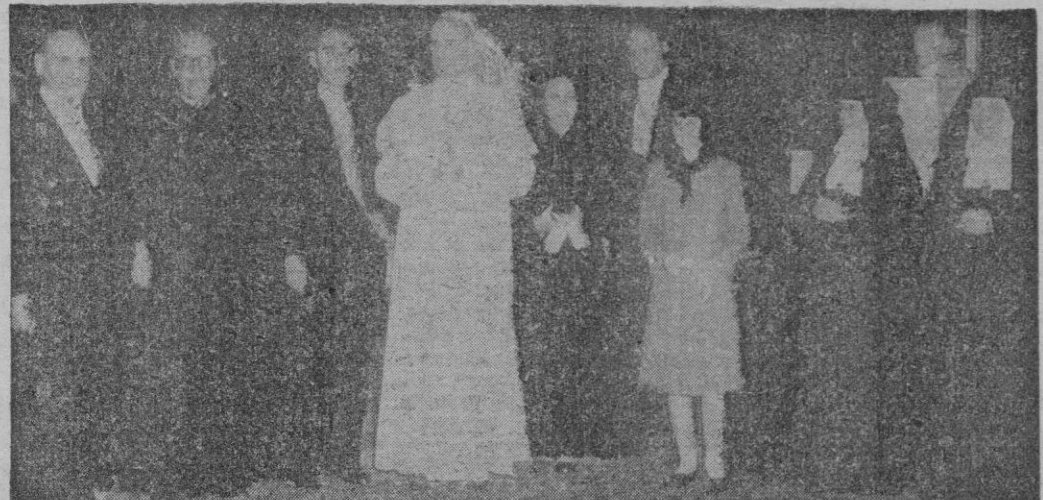
Ciudad del Vaticano. — S. S. Pio XII durante la audiencia privada concedida al Ministro de Agricultura, señor Cavestany, acompañado de su esposa e hija, del Embajador español en la Santa Sede, señor Castiella y otros españoles asistentes a los actos de beatificación de la Madre Maria Rafaela del Sagrado Corazón, fundadora de la Orden de las Esclavas.

AUDIENCIA DE S. S. EL PAPA AL MINISTRO DE AGRICULTURA ESPAÑOL