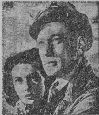
La pareja protagonista en una escena.

"El enigma... ¡de otro mundo!" pertenece al clásico género 'olletresco', fantástico sin excesiva originalidad, pero de no poco eco en el gran sector del público que