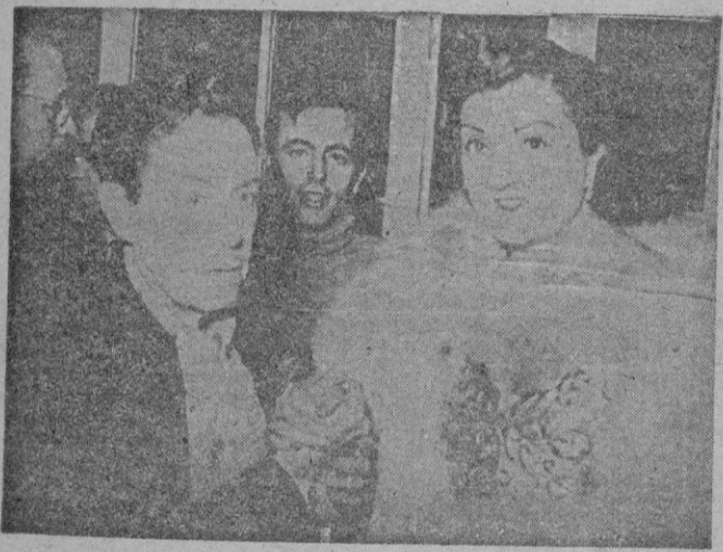
BODAS DE ORO CON LA ESCENA

Madrid.—La actriz Nini Montán saluda efusivamente al veterano actor Ernesto Vilches, que celebró sus bodas de oro con la escena.