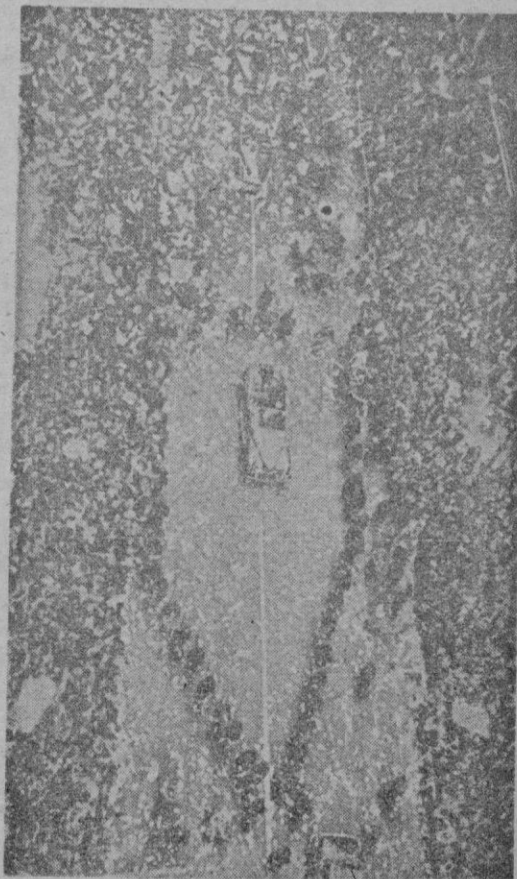
El capitán Carlsen, que durante varios días conmovió a la opinión mundial con su hazaña marinera, aguanta impávido, el temporal de homenajes que la ciudad de Nueva York desató sobre él a partir del tradicional recibimiento.