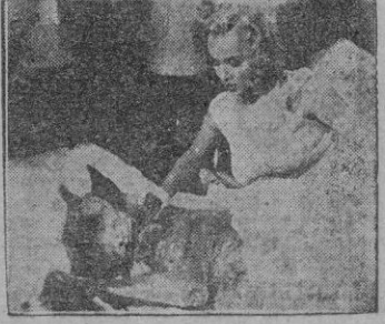
Una escena de la película.

Una rebuscada comedia cinematográfica—no recién salida de los estudios, precisamente —, en la que hay que poner la mejor voluntad para que todo tenga la gracia que se buscaba.