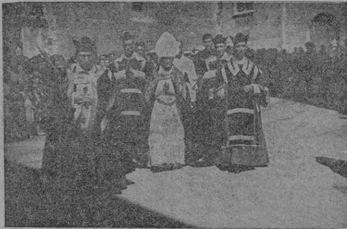
Tarragona.— El Cardenal Primado, que ofició el solemne funeral celebrado en la Catedral, preside la comitiva durante el paso del féretro por las calles de la ciudad.