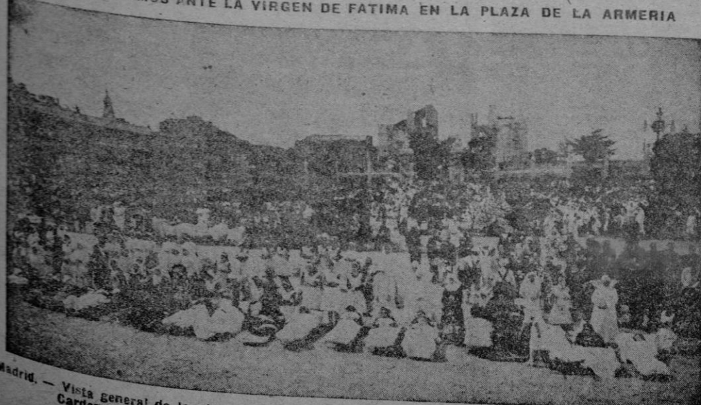
Madrid. — Vista general de la plaza de la Armeria durante la Misa de Enfermos oficiada por el Cardenal Cerejeira, ante la imagen de la Virgen de Fátima.

MISA DE ENFERMOS ANTE LA VIRGEN DE FATIMA EN LA PLAZA DE LA ARMERIA