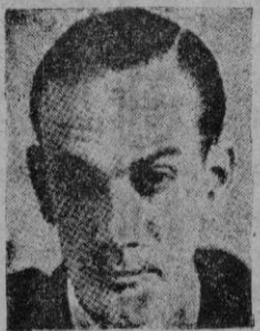
CAMILO JOSE CELA