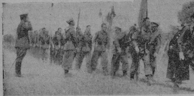
Valladolid. — Un momento de la Jura de la Bandera de las Milicias Universitarias, en el campamento de Monte la Reina (Foto «Cifra»).