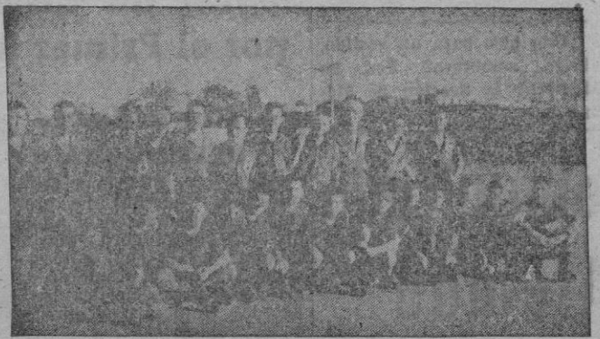
Los equipos de Infantería de Marina y Base Naval, que anteayer se enfrentaron, en el campo de la Antoniana, terminando el partido con empate a dos tantos