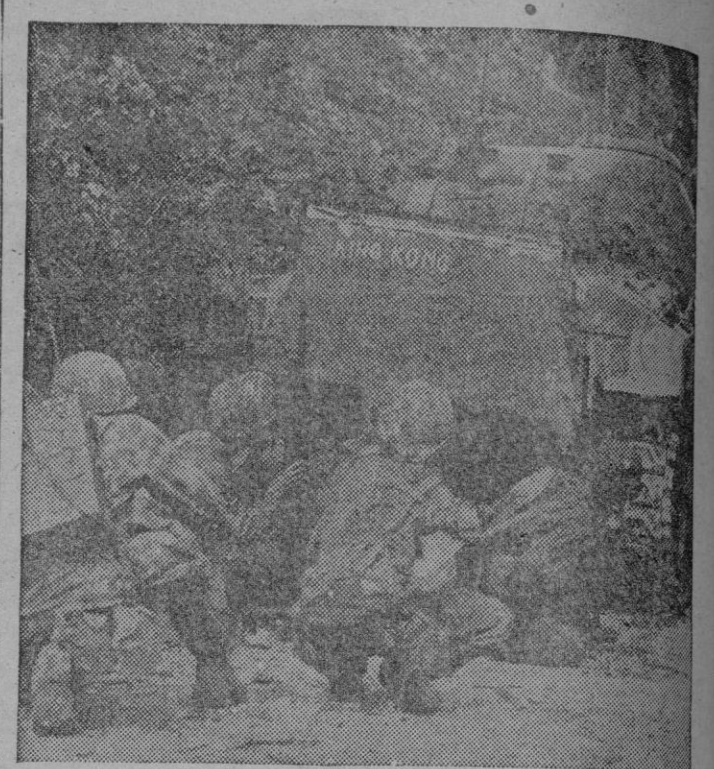
Soldados norteamericanos de Infantería de Marina se guarnecen detrás de un tanque para luchar contra grupos aislados de japoneses en la Isla de Leyte.