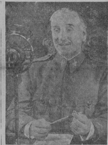
QUEIPO DE LLANO

Madrid. — Decreto. Es evidente la influencia que tuvo en la Guerra de Liberación la posesión de Sevilla, llave del Sur y enlace con Marruecos. El éxito logrado en la conquista de esta plaza se debió al entusiasmo, pericia y valor del entonces General de División don Gonzalo Queipo de Llano y Sierra, que al iniciarse el Glorioso Alzamiento Nacional, se presentó desde el primer momento en Sevilla y tomó el mando de las fuerzas de la plaza y de toda Andalucía. Por especiales circunstancias de nuestra guerra, actuó de hecho como General en Jefe y asumió las supremas atribuciones y responsabilidades desde el 18 de julio de 1936 al 24 del mismo mes, en cuyos días precisamente se realizó la heroica ocupación de la plaza y ciudad antes citada. Más tarde creó ya el órgano sede del Gobierno, capacitado para hacer nombramientos se le nombró por Decreto de 26 de agosto de 1936, General en Jefe de las fuerzas de Andalucía en cuya etapa de mando y de derecho el prestigio alcanzado por este General en la conquista de Sevilla se confirmó y extendió a toda España y Esta su actuación infatigable, tanto con respecto a mantener y levantar el espíritu nacional. Esta heroica actuación en nuestro comprendido Real y Militar Orden de San Fernando. En su virtud a pro y previo acuerdo del Consejo de Ministros.