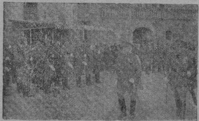
El Excmo. Sr. Capitán General revistando el Regimiento de Artillería que le rindió honores con motivo de la Festividad de Santa Bárbara.