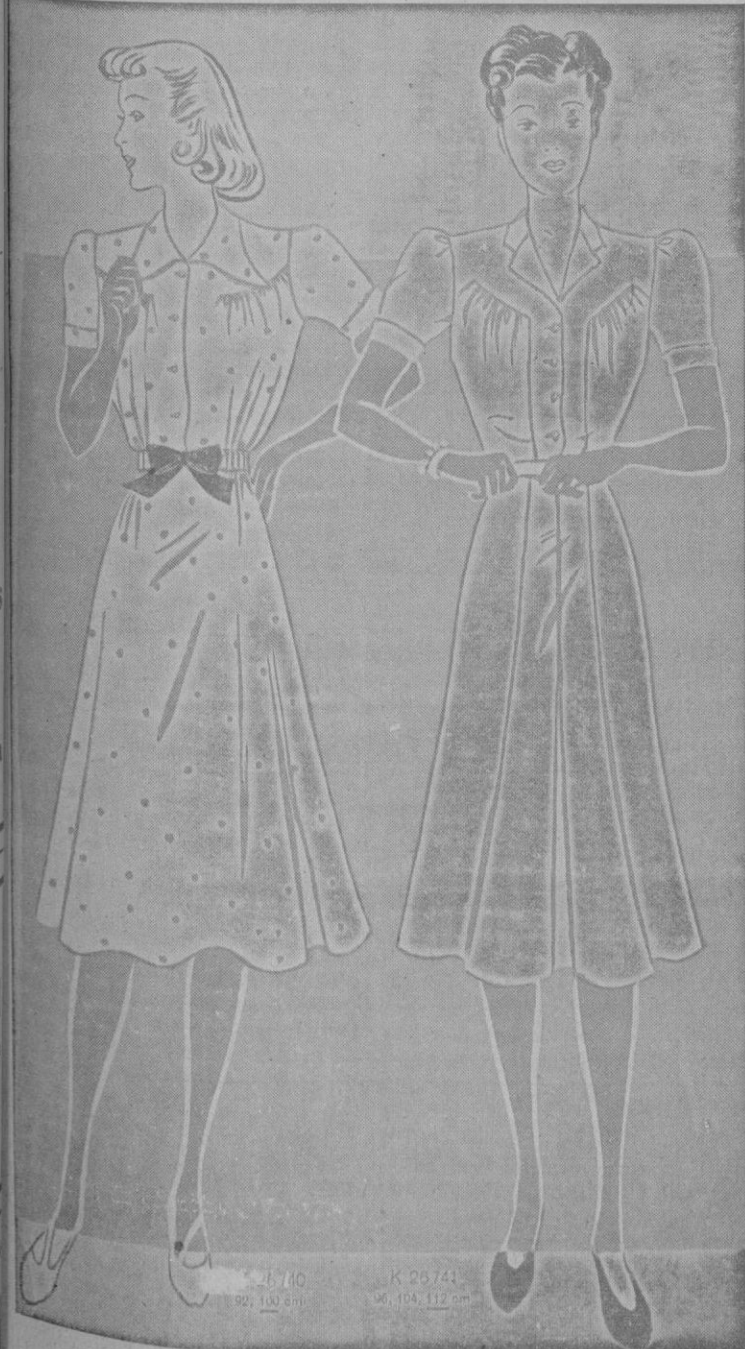
Dos sencillos vestidos de verano para jovencitas

B. Darder Hevia Medicina General Consulta los miércoles y sábados de 11 a 2 Calle Temple, 5 Teléfono 2316