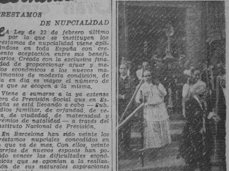
Momento de salir la Custodia de la iglesia de Santa María del Mar, en la procesion celebrada con gran solemnidad en el día de ayer, con motivo de la infraestructura del Corpus.