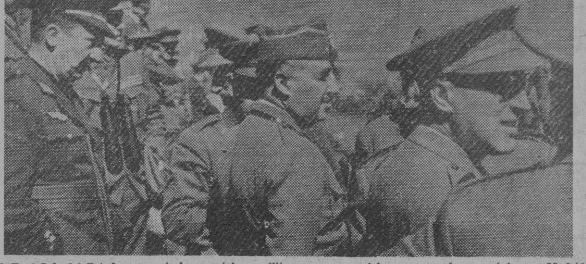
S. E. el Jefe del Estado presencia las maniobras militares que se celebran en un lugar próximo a Madrid