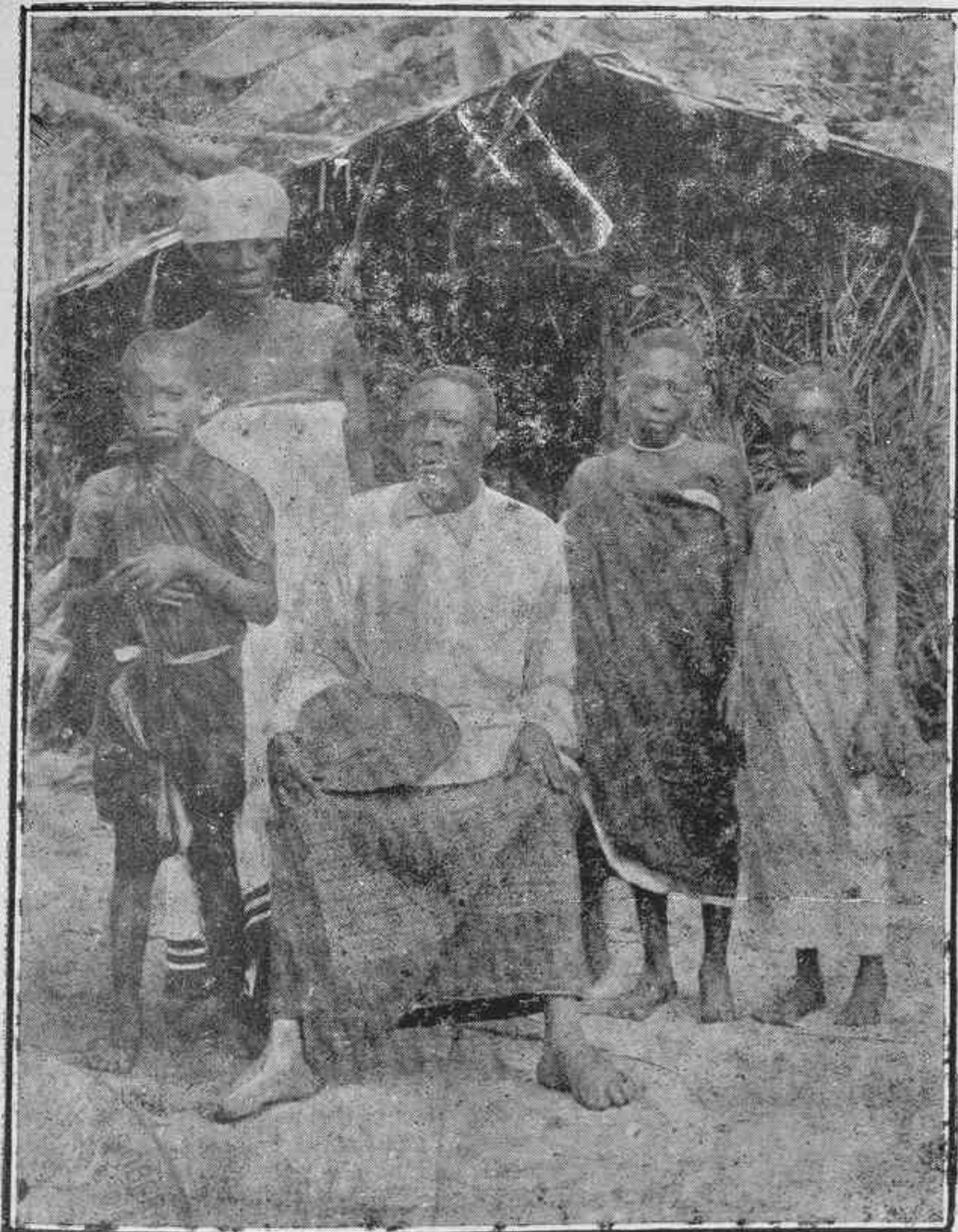
Nuestro grabado Una Familia Bapuku.

SUMARIO. —Portada —Una Familia Bapuku —Alicante—Portugal — Gobierno de la Colonia —Noticias de la Colonia; de Rebola —Radios de Prensa.