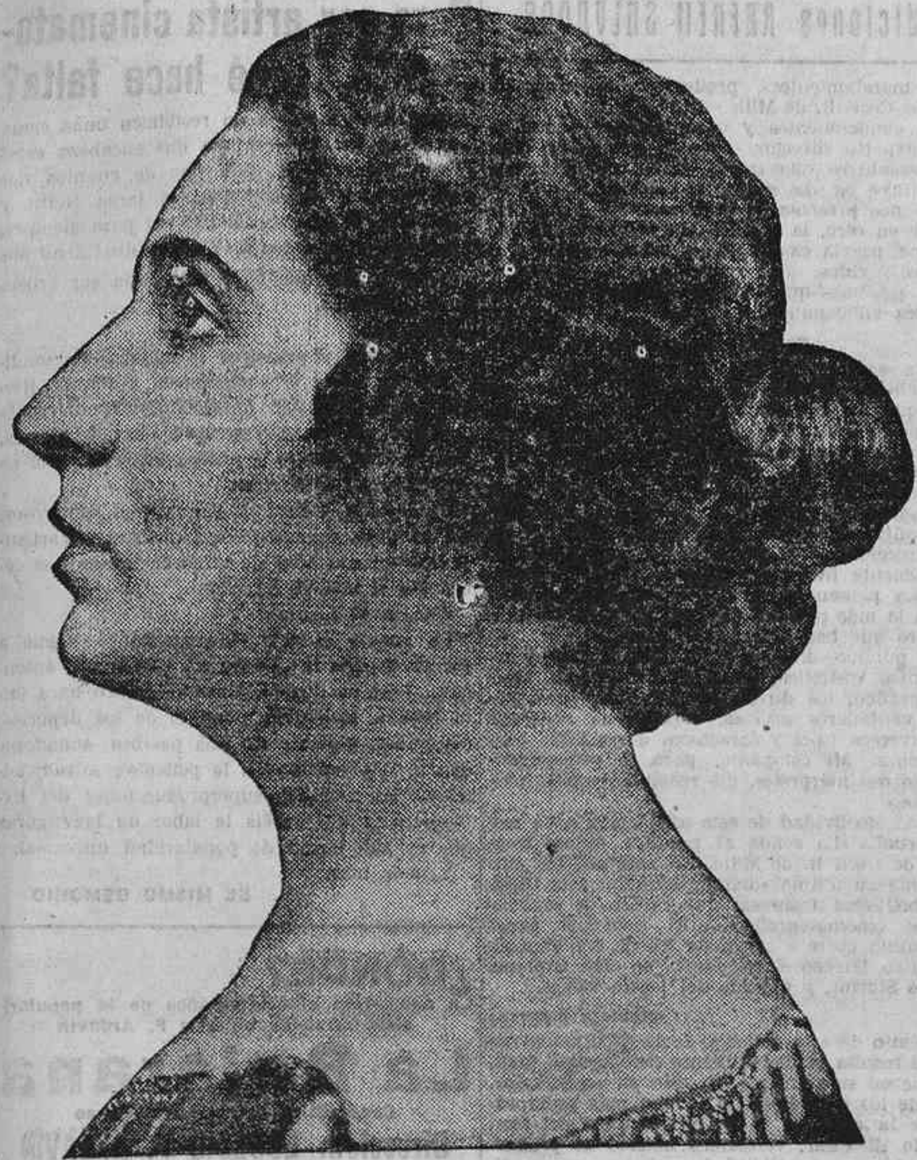
LOLA MEMBRIVES, INSIGNE INTERPRETE DE «LA NIÑA DE PLATA»