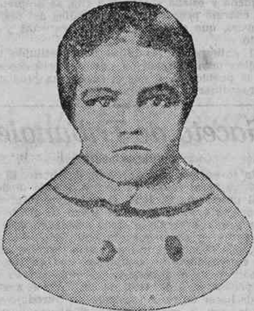
Con M. X., a los cuatro años de edad

Palida y como exánime yacía Asunción sobre la tierra verdeada. Manuel, que hasta entonces no supo a quién había salvado la vida y cuál era la codiciada carga que iba a tomar entre sus brazos, corrió a ponerla sobre su cabalgadura y con ella alejóse como un centauro victorioso cuya gallarda silueta se encendía a la roja luz de un sol que iba muriendo en su lecho de fuego.