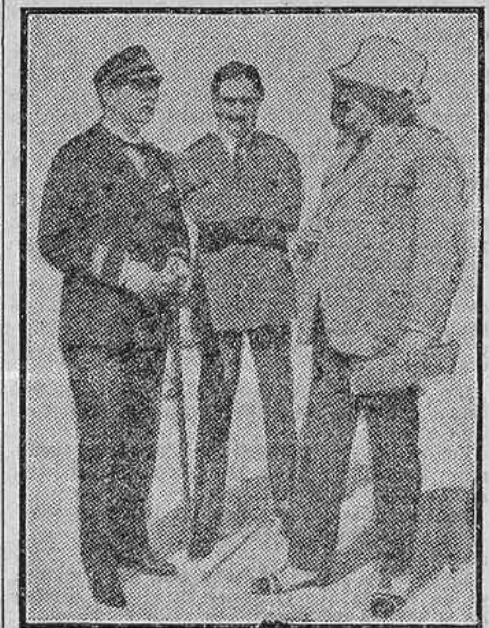
Blasco Ibáñez y Antonio Moreno, en Hollywood

Lanzada al mercado norteamericano recientemente, la joya cinematográfica a que nos referimos ha sido aclamada en los principales cinematógrafos de aquel país como la obra maestra del arte mudo; más grande, inclusive, que «Los