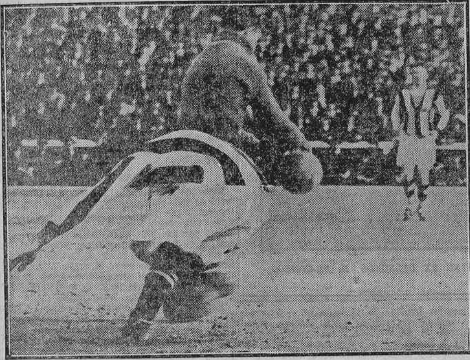
DEL PARTIDO RACING-GIMNASTICA.—UNA OPORTUNA SALIDA DEL PORTERO DEL RACING

Almacenes, 3; Patronato, 0. Norte, 5; Cultural, 0.