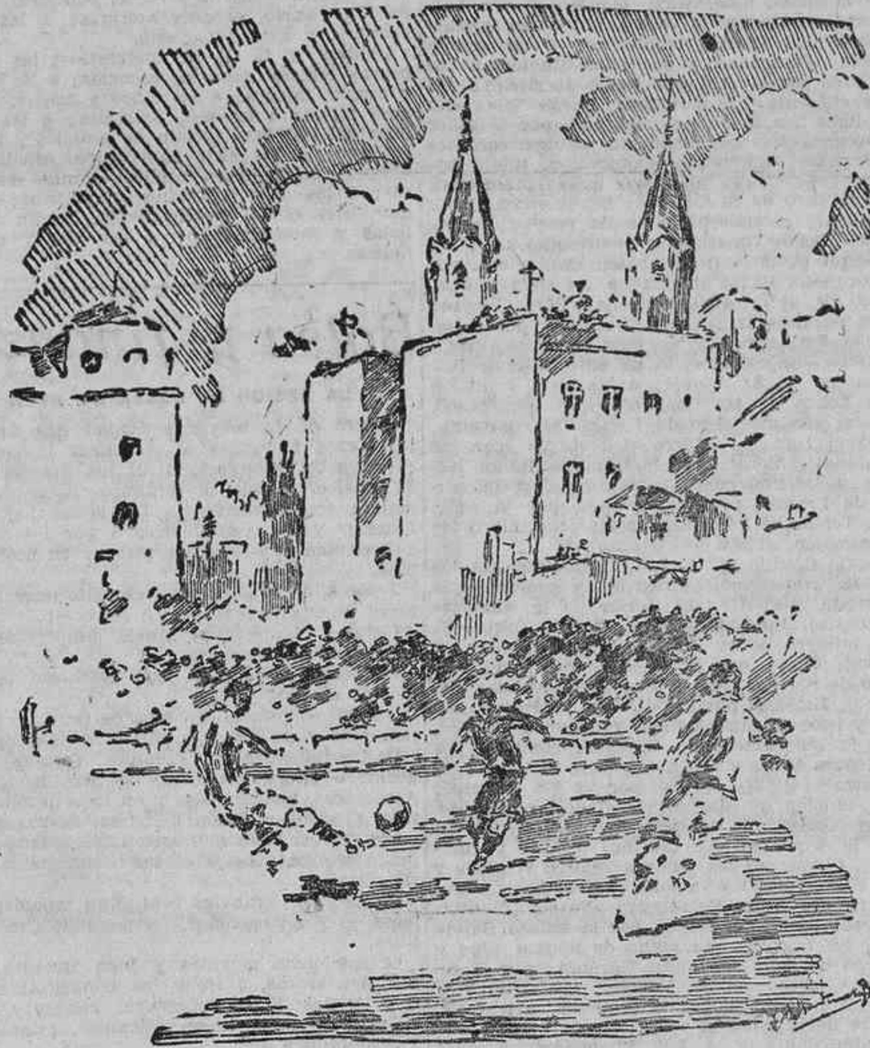
UN DETALLE DEL PARTIDO RACING-GIMNASTICA (Apunte del natural por Martínez Bande.)

como eje del equipo. A su actuación debió en gran parte el Racing Club que el triunfo fuese