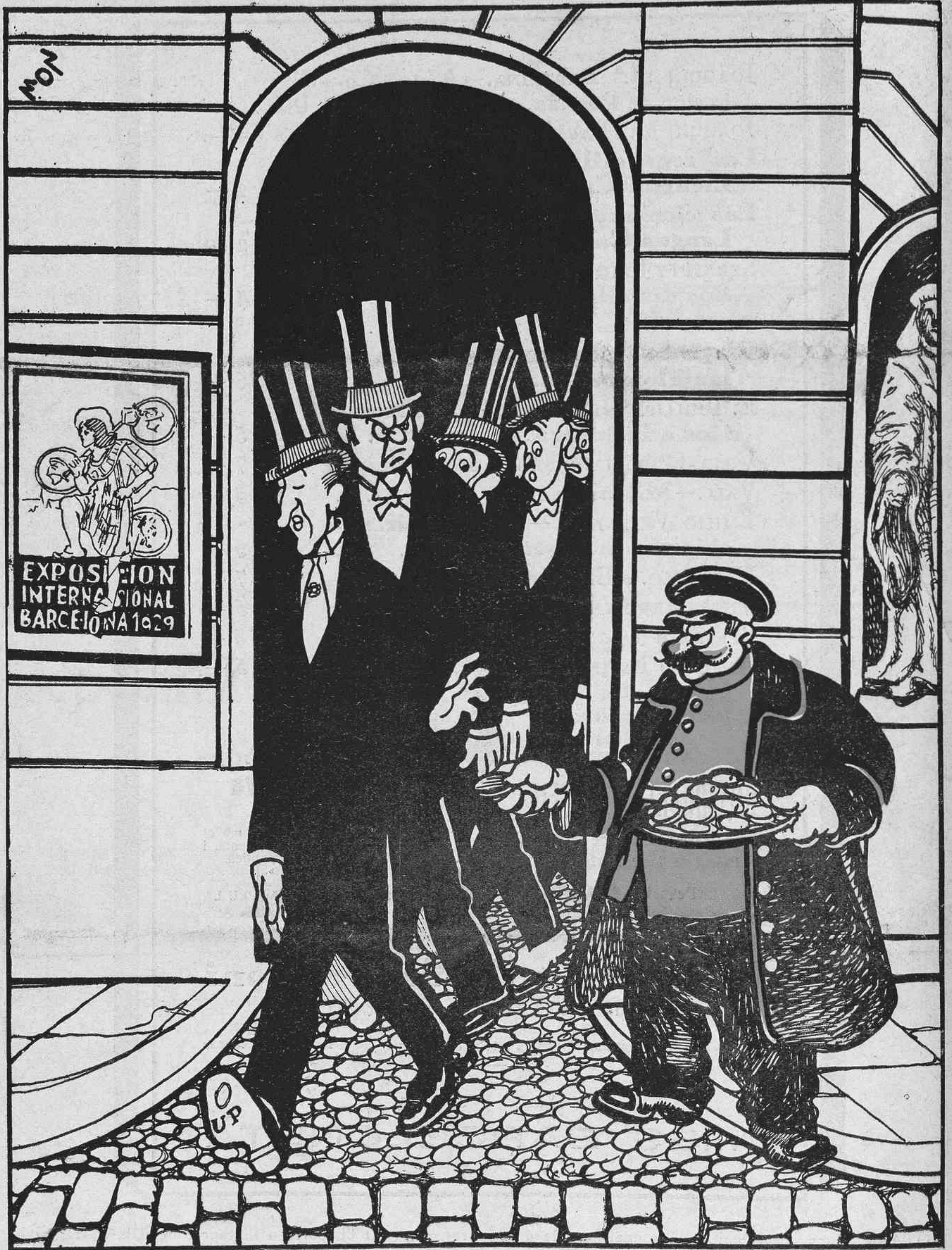
Els regidors que se'n van.