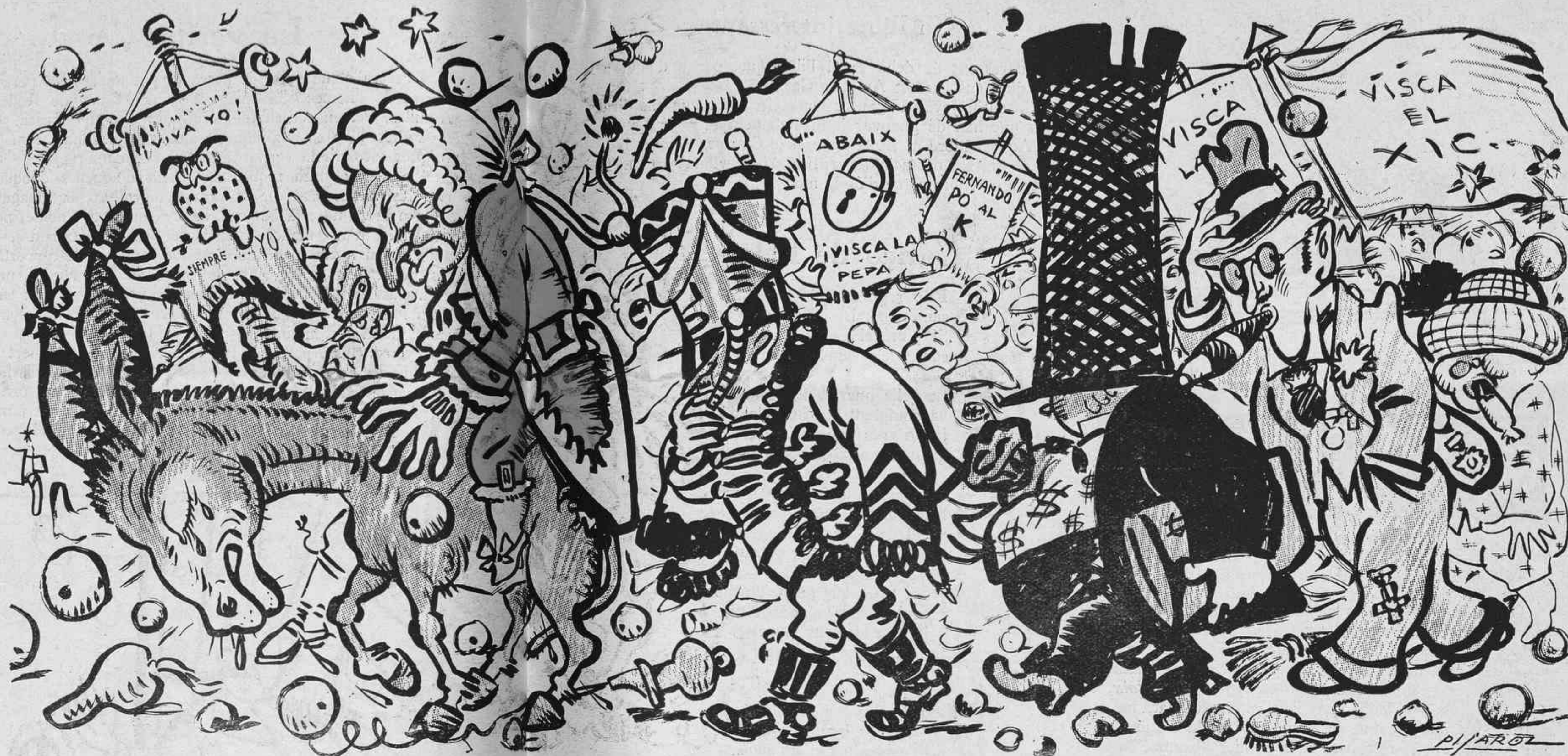
La gloriosa retirada