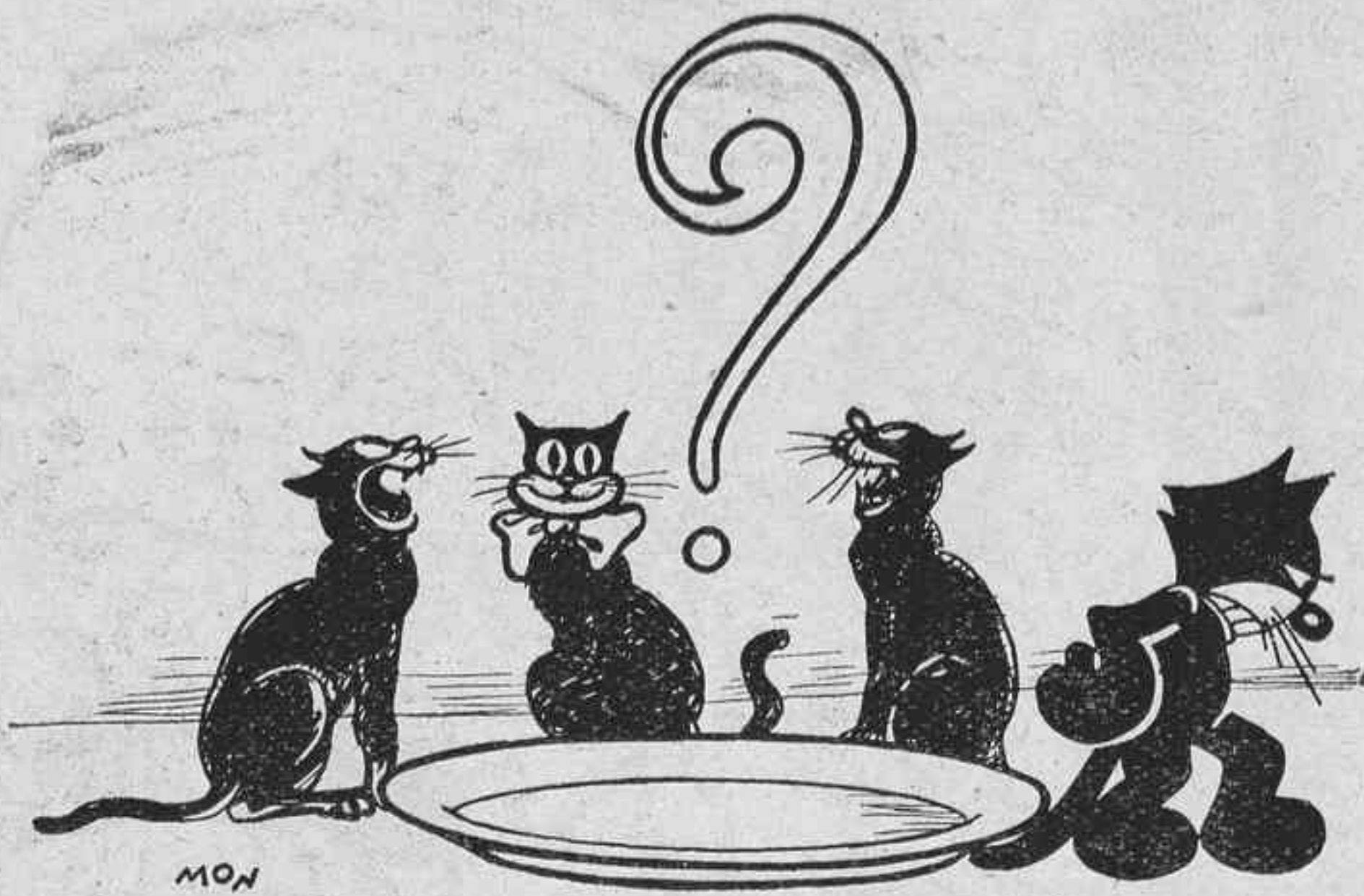
Els quatre gats de la U. P... i aviat no seran ni quatre.