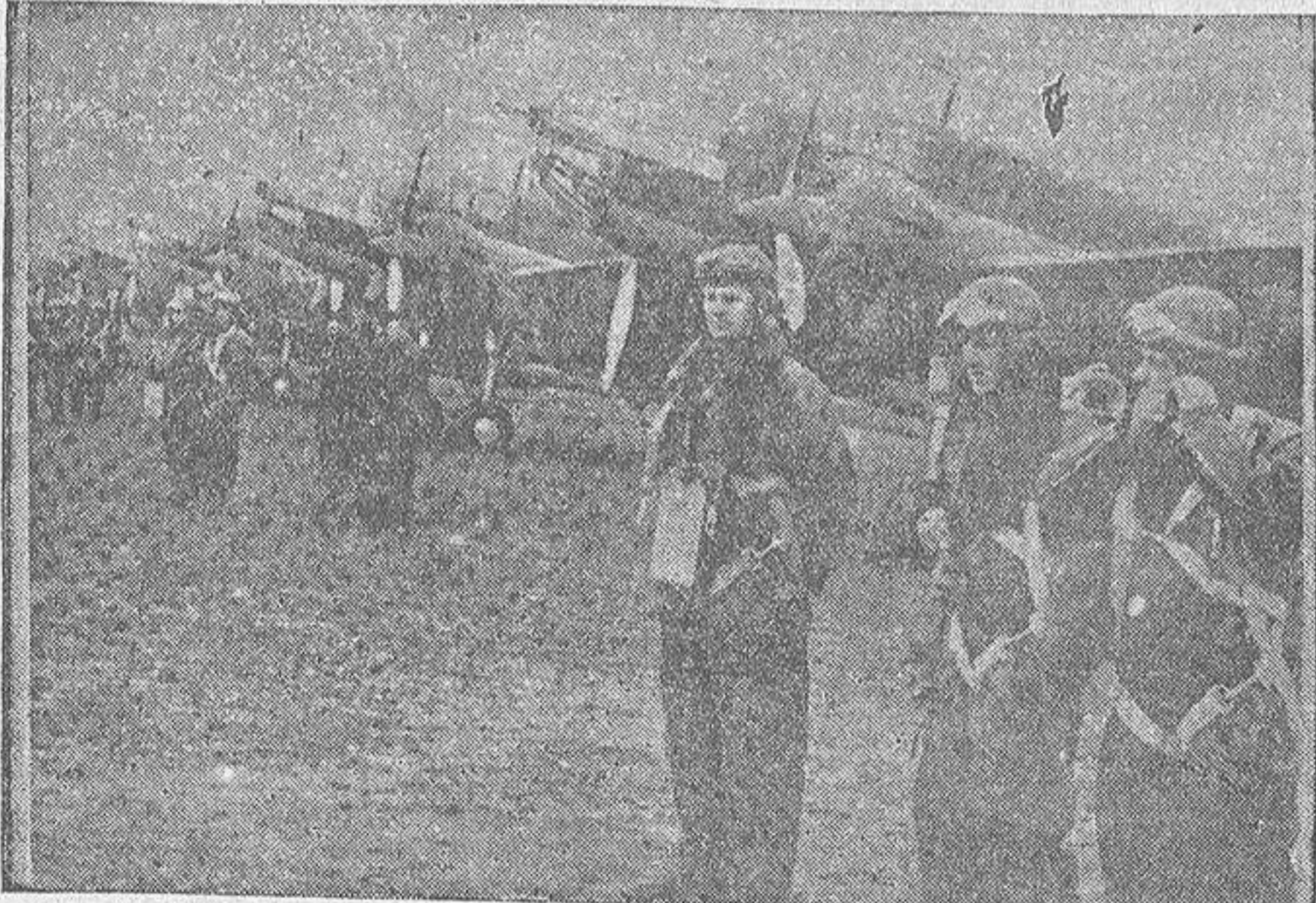
Grupo de aviadores polacos al lado de sus respectivos aparatos, durante las grandes maniobras aéreas que Polonia celebró recientemente en las proximidades del territorio de Dantzig, punto neurálgico de Europa

Las propuestas del Reich no podían ser más modestas y consideradas