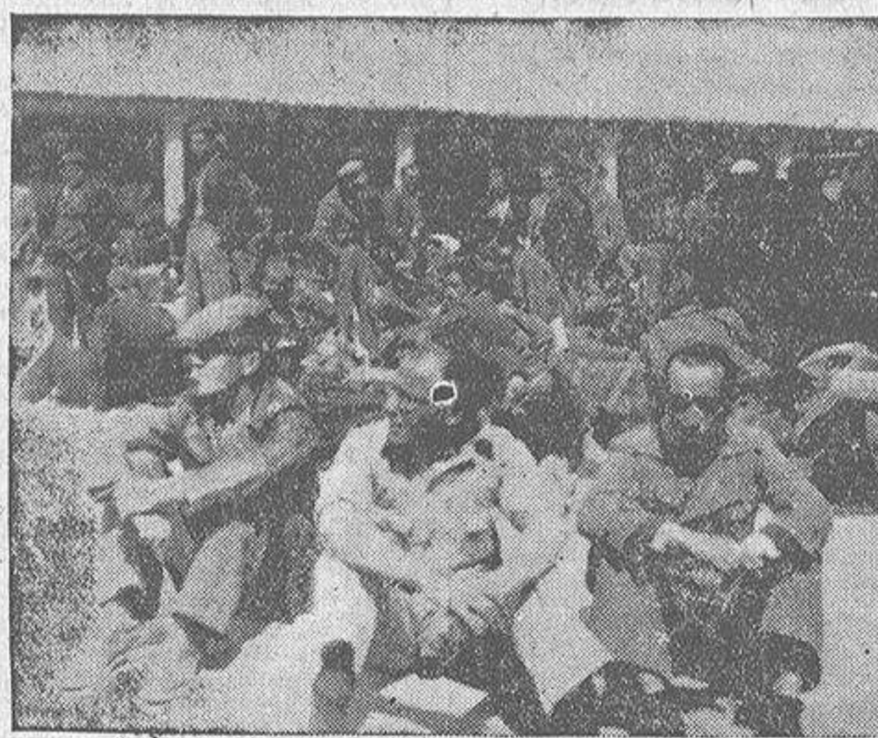
Comisarios políticos, coroneles, capitanes, gobernadores rojos y otros significados marxistas prisioneros en Alicante

"L'Ouvre" dice que en las negociaciones se propuso a Ruma-