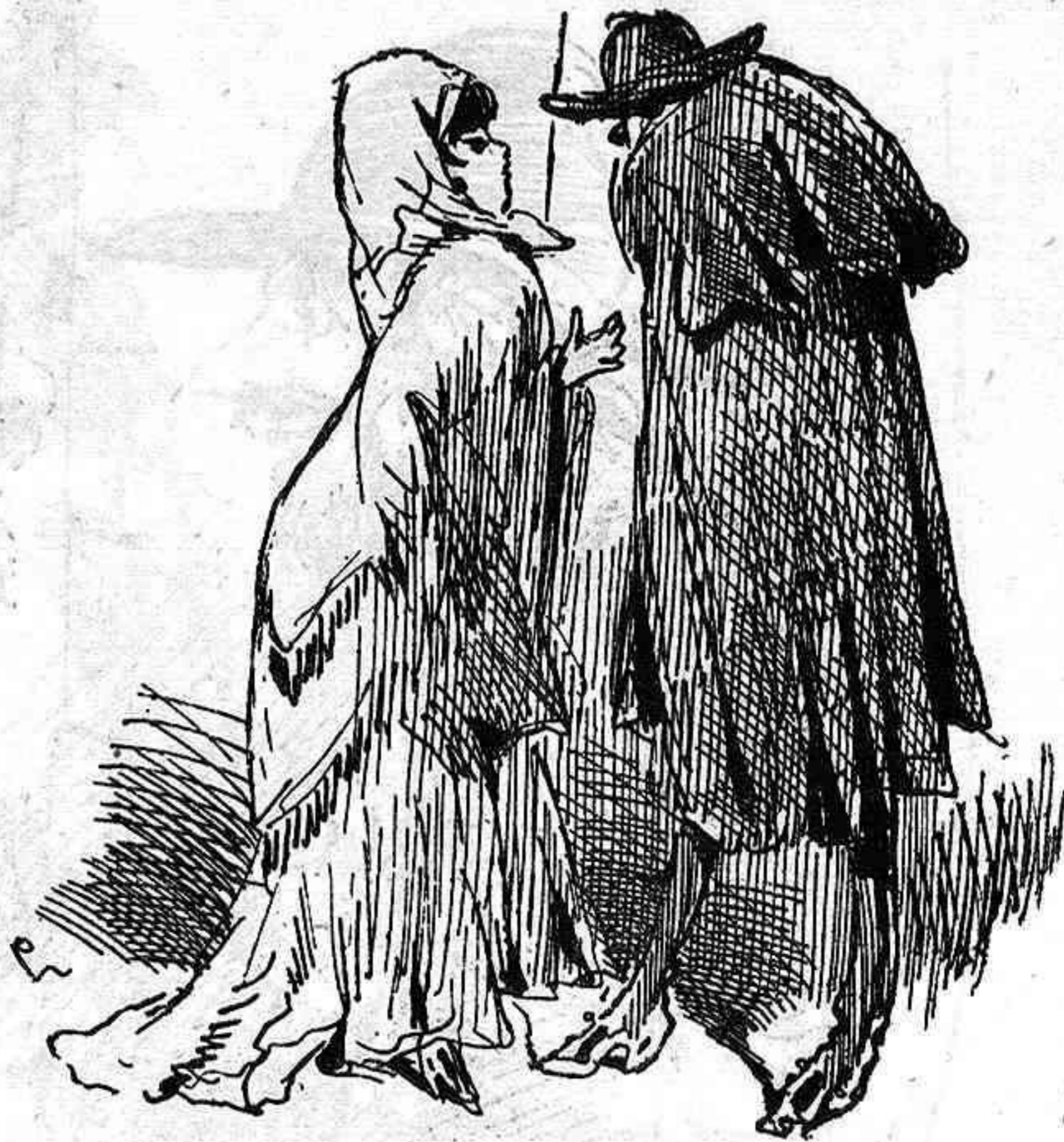
—Hijo, ¿qué quieres? Mi tia...