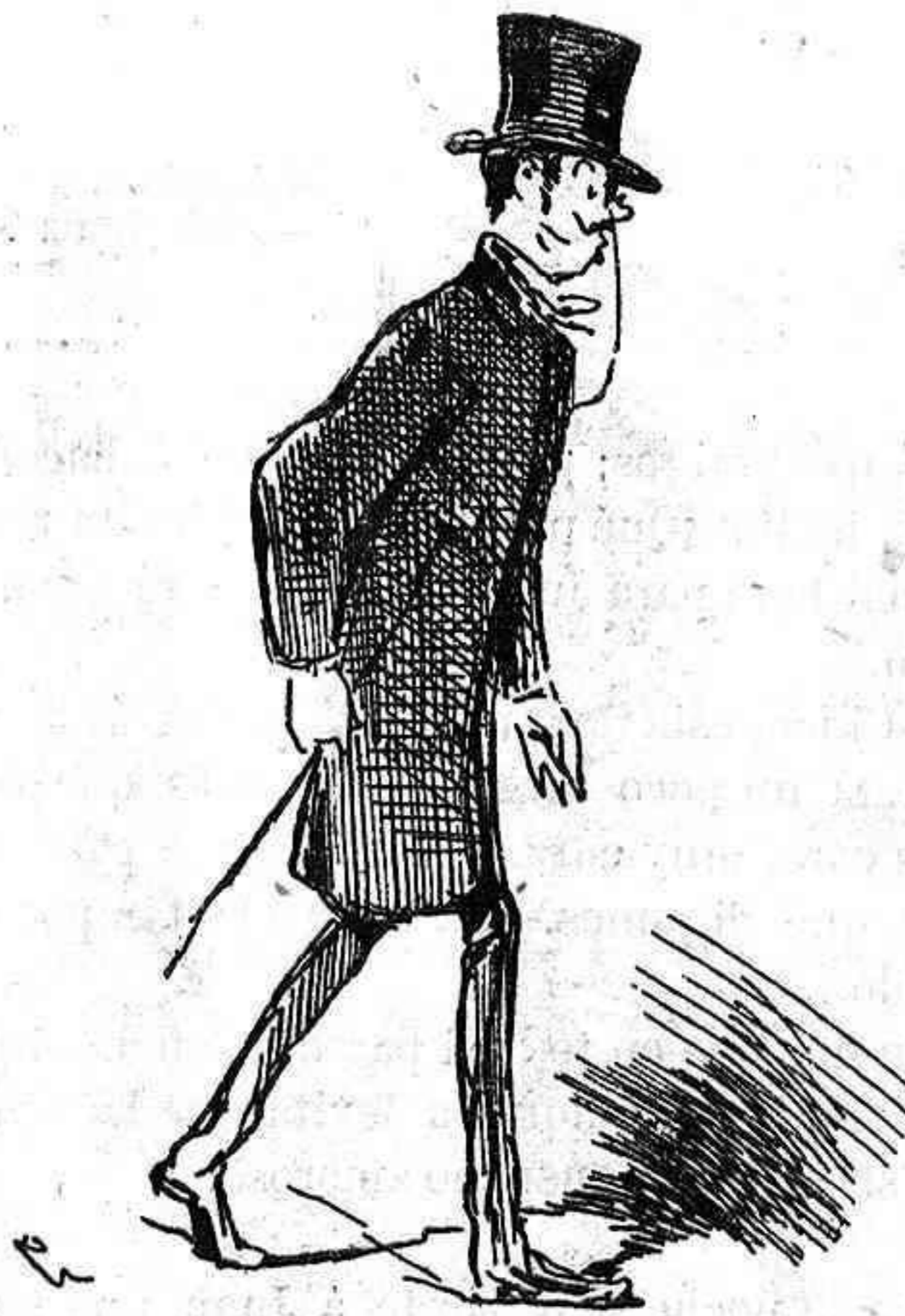
—¡Yo me tengo la culpa en querer tratar con gente grosera!

que es lo que ha hecho creer á Juan que el paño es inmejorable.