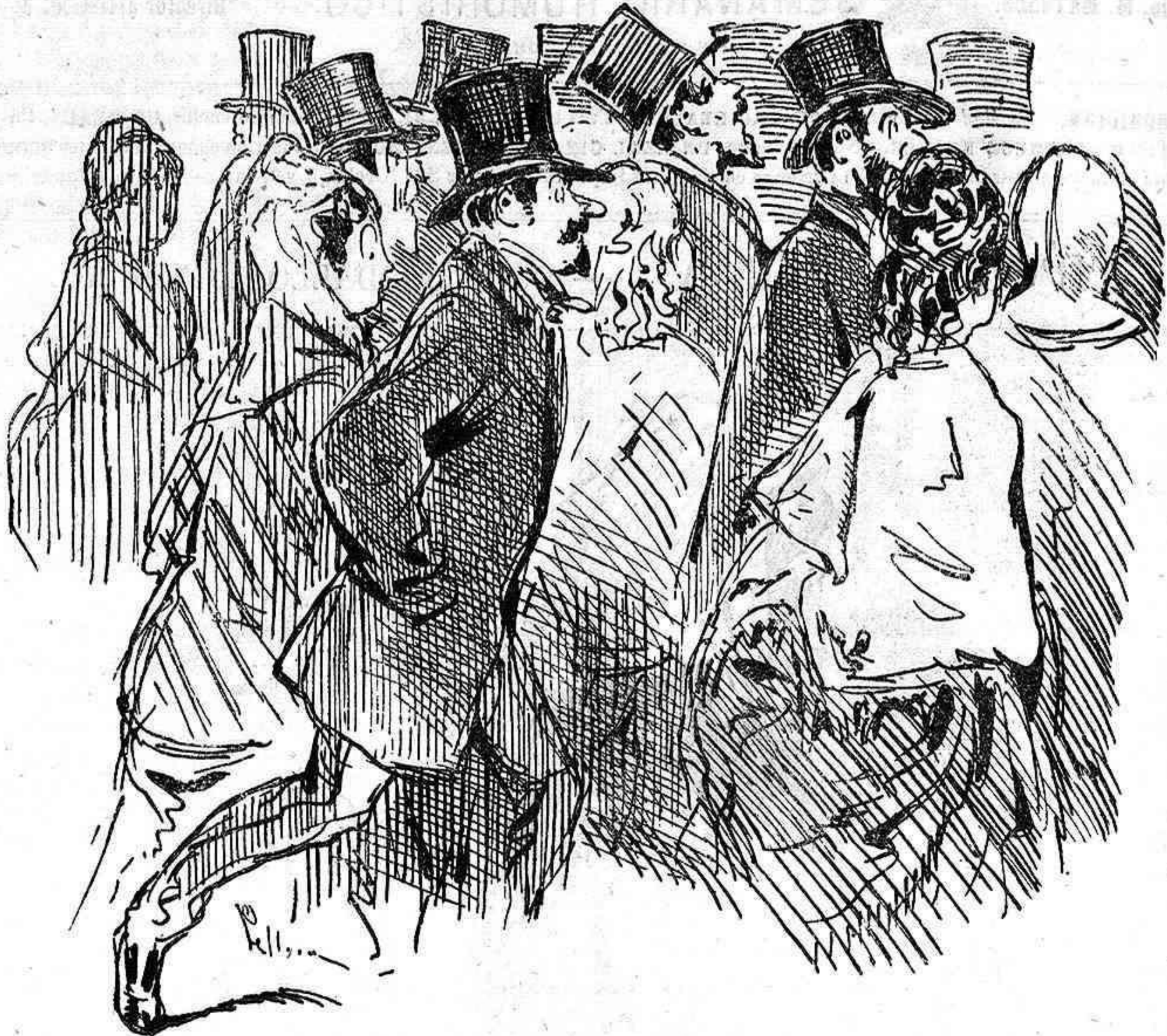
¡Al castillo de Simancas...!