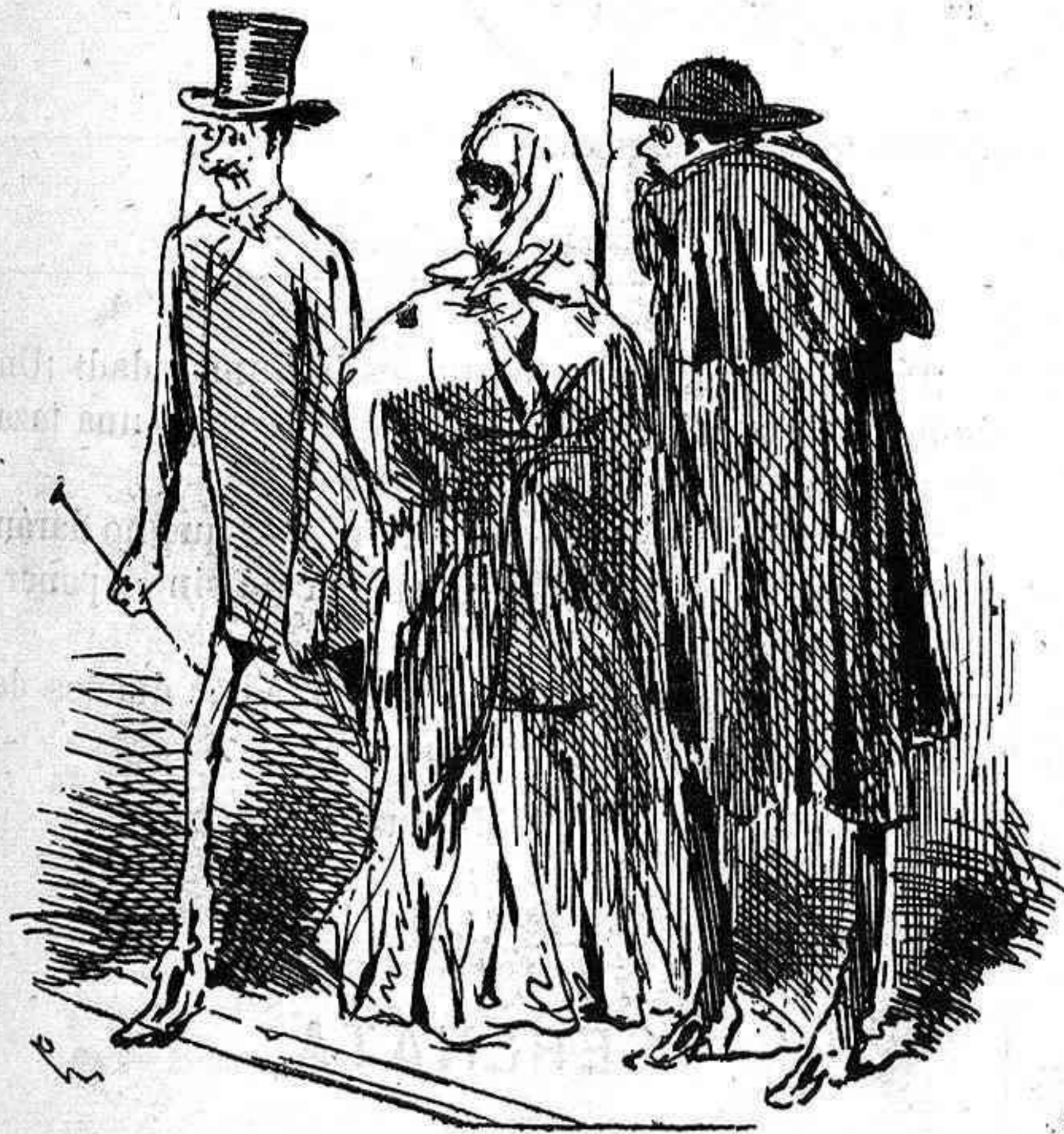
—¿Quiusté que le apubulle la sesera, so silbante?