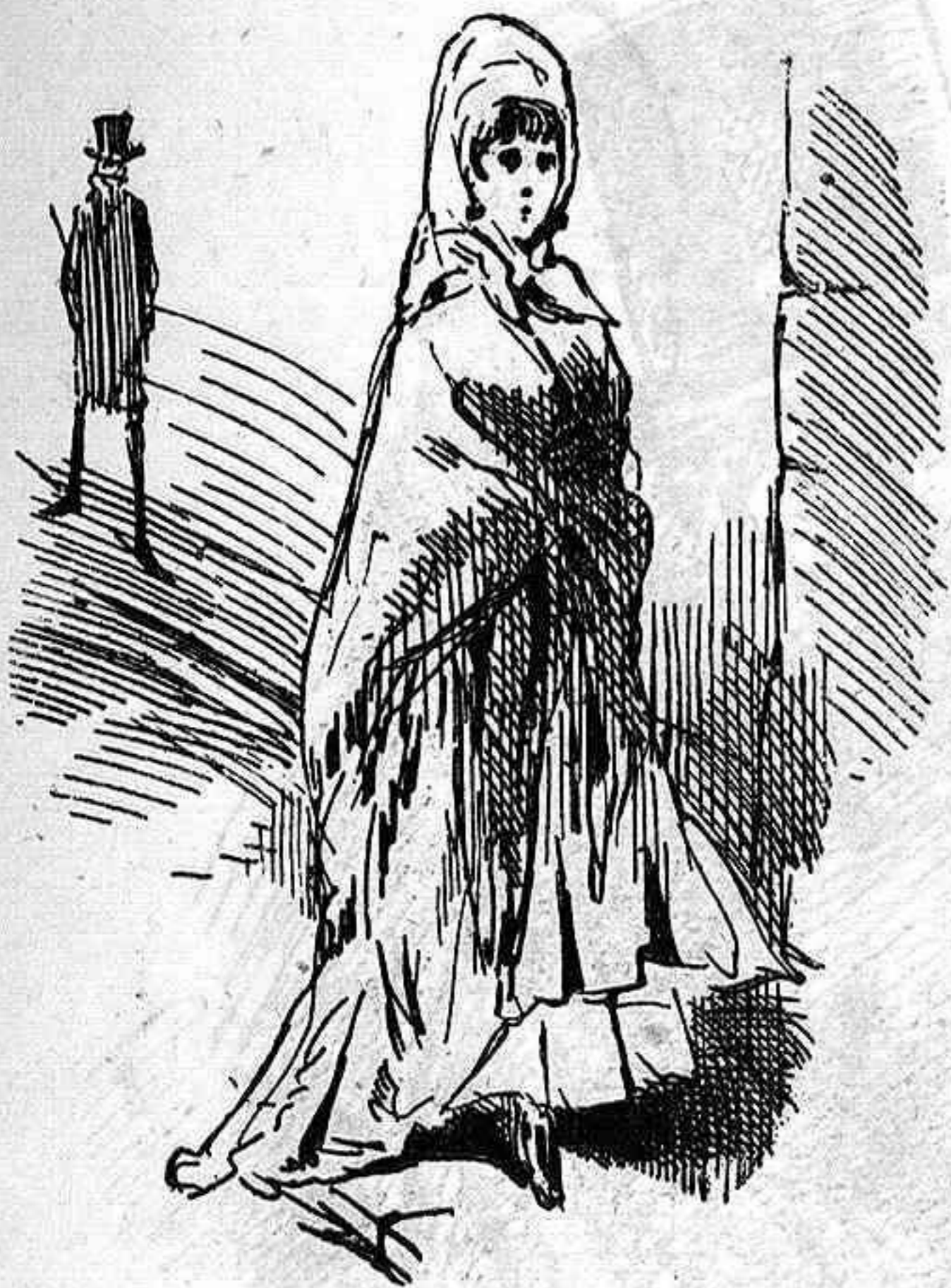
—Con tal de que él no me arme bronca porque voy tarde...