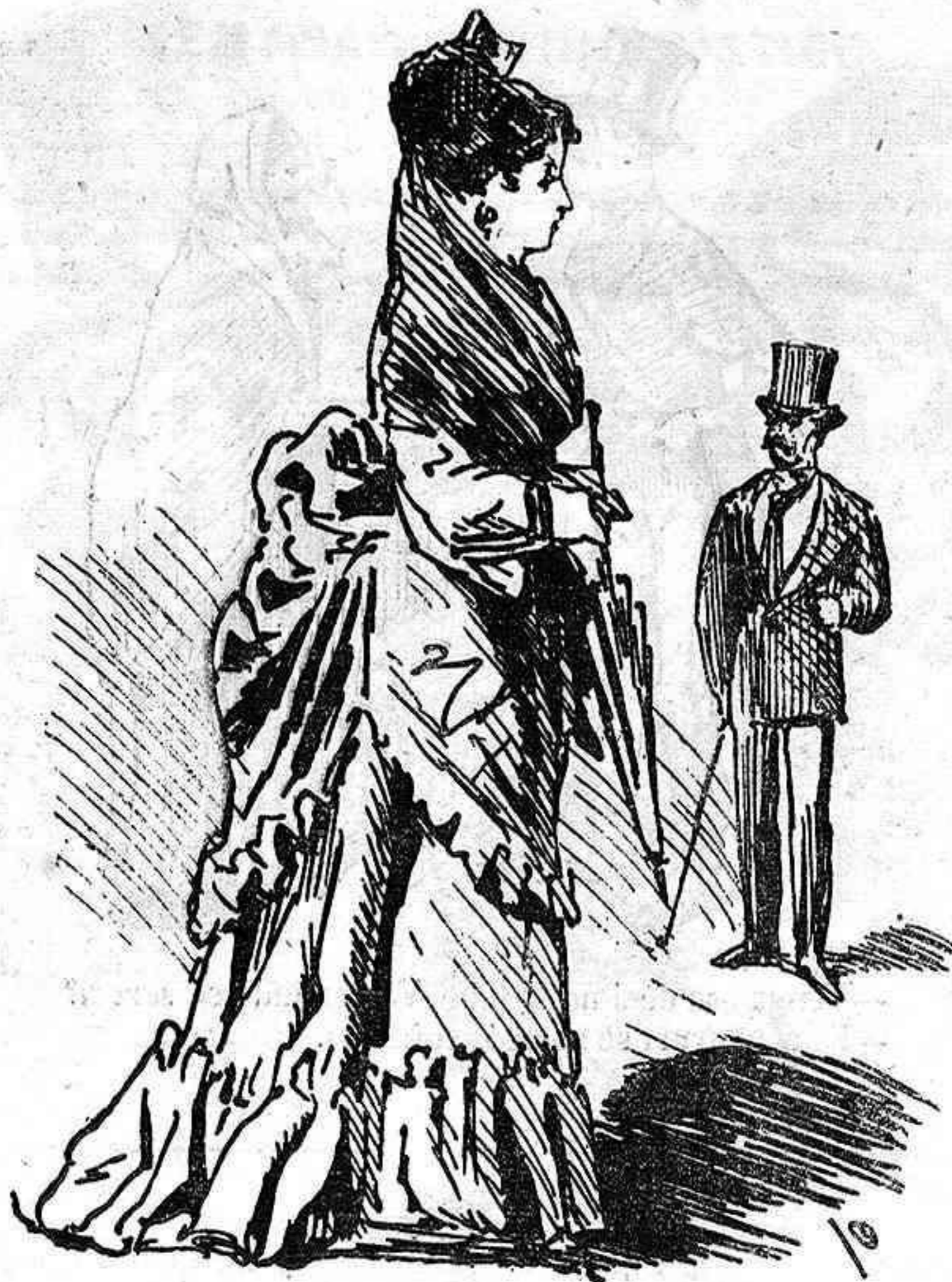
Hace un año. — La peineta.

¡Ay, sal por piedad, no alborote el fervor de mi súplica la vecindad!